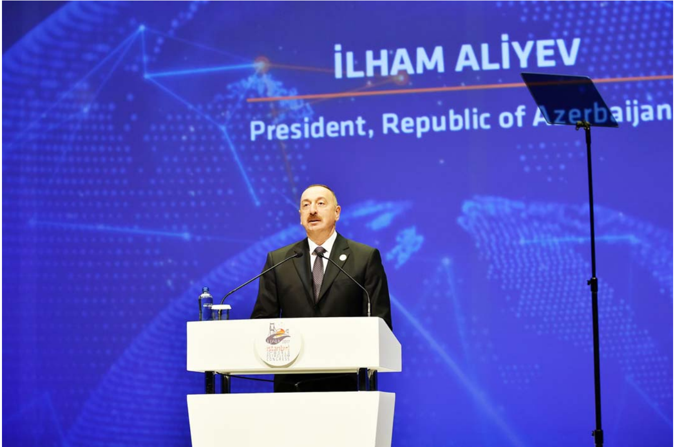
Konqresdə Azərbaycan Prezidenti İlham Əliyevin çıxışı

Albaniyanın Baş naziri Edi Rama da neft-qaz sektorunun inkişafı sahəsində ölkəsinin böyük imkanlarının olduğunu, bu baxımdan Balkan regionunda önəmli məntəqəyə çevrildiyini bildirib. Neft-qaz, ümumiyyətlə, enerji sektorunda Albaniyanın böyük perspektivlərindən danışan Edi Rama Xəzərdən gələn enerjinin 2020-ci ildə Avropaya çatacağını və Albaniyanın da təbii qazın qitəyə ötürülməsində önəmli məntəqə olduğunu söyləyib, enerji sahəsində fəaliyyət göstərən şirkətləri ölkəsinə sər-mayə qoymağa dəvət edib.