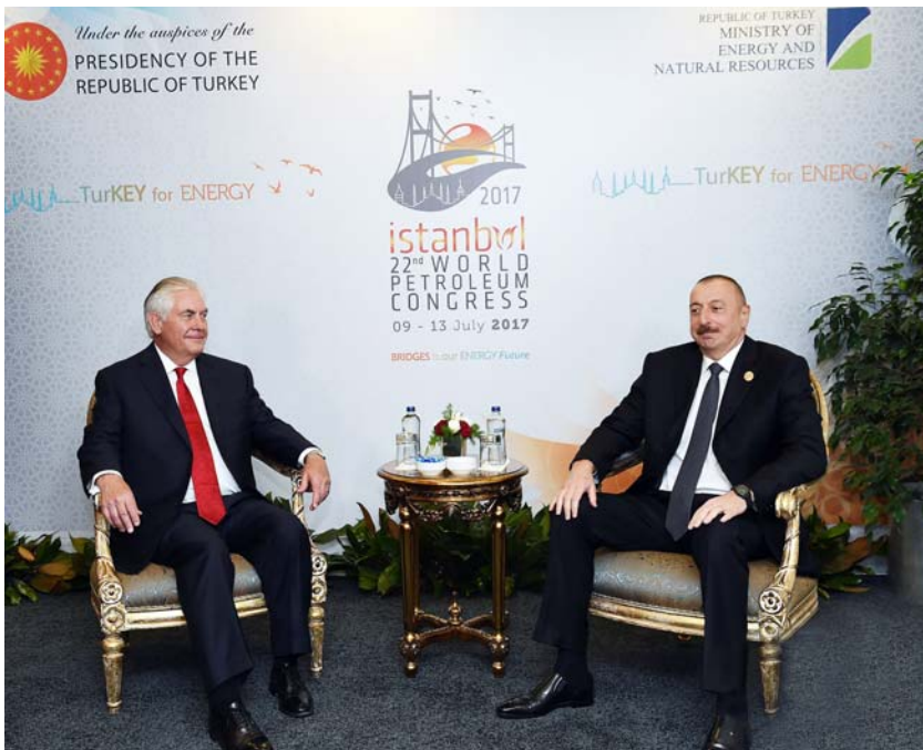
ABŞ-ın dövlət katibi Reks Tillerson ilə görüş

Söhbət zamanı, həmçinin ölkəmizdə həyata keçirilən siyasi və iqtisadi islahatlar, demokratiyanın inkişafı ilə bağlı məsələlər müzakirə edilib.