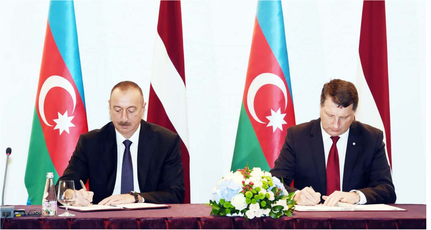
Azərbaycan-Latviya sənədlərinin imzalanması

Sonra görüş nümayəndə heyətlərinin iştirakı ilə geniş tərkibdə davam etdirilib. Görüşdə ölkələrimiz arasında müxtəlif sahələrdə əməkdaşlığın genişləndirilməsi üçün böyük imkanların olduğu bildirilib, Azərbaycanın beynəlxalq nəqliyyat dəhlizlərində, o cümlədən Şərq-Qərb, Şimal-Cənub dəhlizlərində, Asiya ilə Avropa arasında yükdaşımalarda önəmli rolu qeyd edilib. Dövlətimizin başçısı Azərbaycanın beynəlxalq nəqliyyat əməkdaşlığı sahəsində gördüyü işlərdən danışib.