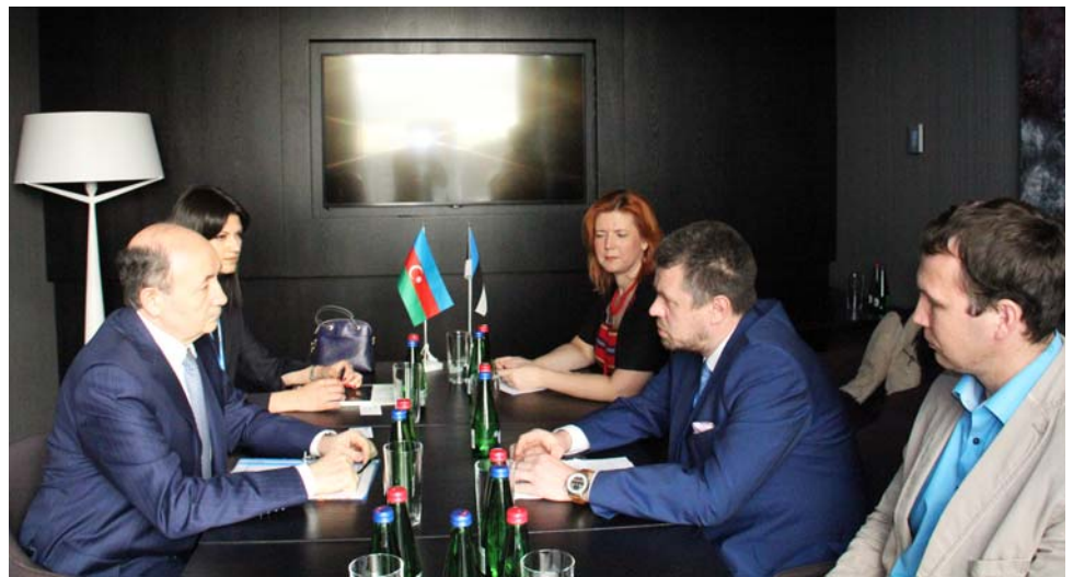
Estoniyanın ədliyyə naziri Urmars Reinsalu ilə görüş

Səfər zamanı F.Məmmədov və Estoniyanın ədliyyə naziri Urmars Reinsalu ilə ikitərəfli görüş keçirilib. Görüşdə iki ölkə arasında hüquqi sahədə əməkdaşlığın inkişafı üçün yaxşı perspektivlərin