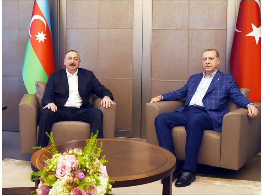
Türkiyə Prezidenti Rəcəb Tayyib Ərdoğan ilə görüş

Azərbaycan və Türkiyə prezidentləri ölkələrimizin hərbi sahədə əməkdaşlığının daha da genişləndirilməsi və möhkəmləndirilməsi haqqında söhbət ediblər. Görüşdə Ermənistan-Azərbaycan, Dağlıq Qarabağ münaqişəsinin həlli ilə bağlı məsələlər müzakirə edilib. Prezident İlham Əliyev son vaxtlar təmas xəttində Ermənistanın təxribatları və hərbi cinayətləri barədə Türkiyə Prezidentinə ətraflı məlumat verib. Prezident Rəcəb Tayyib Ərdoğan Türkiyənin həmişə olduğu kimi, Ermənistan-Azərbaycan, Dağlıq Qarabağ münaqişəsinin beynəlxalq hüquq nor-