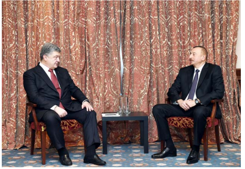
Ukrayna Prezidenti Petro Poroşenko ilə görüş

Görüşdə ikitərəfli münasibətlər və qarşılıqlı