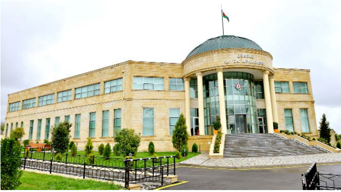
Qəbələ Rayon Məhkəməsinin yeni binası

miyyətinin müstəqil özünüidarə orqanı olan Məhkəmə-Hüquq Şurasının səlahiyyətlərinin xeyli genişləndirilməsi, hakimlərin ən şəffaf seçimi, Dünya Bankı ilə birgə əməkdaşlıqda məhkəmə infrastrukturunun müasirləşdirilməsi, "Elektron məhkəmə" informasiya sisteminin və müasir İKT-lərin geniş tətbiqi məhkəmələrin müstəqilliyini, şəffaflığını və əlçatanlığını daha da artırır.