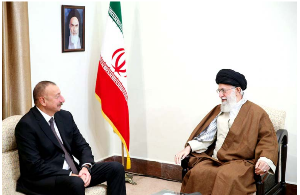
İranda Ali Rəhbəri Seyid Əli Xamenei ilə görüş

Elə həmin gün dövlətimizin başçısı İlham Əliyevin İrana işgüzar səfəri başa çatıb.