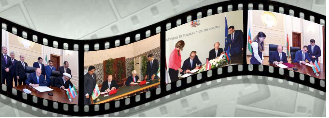
Xarici dövlətlərin Ədliyyə nazirlikləri ilə hüquqi sahədə əməkdaşlıq sənədlərinin imzalanması, 2017-ci il