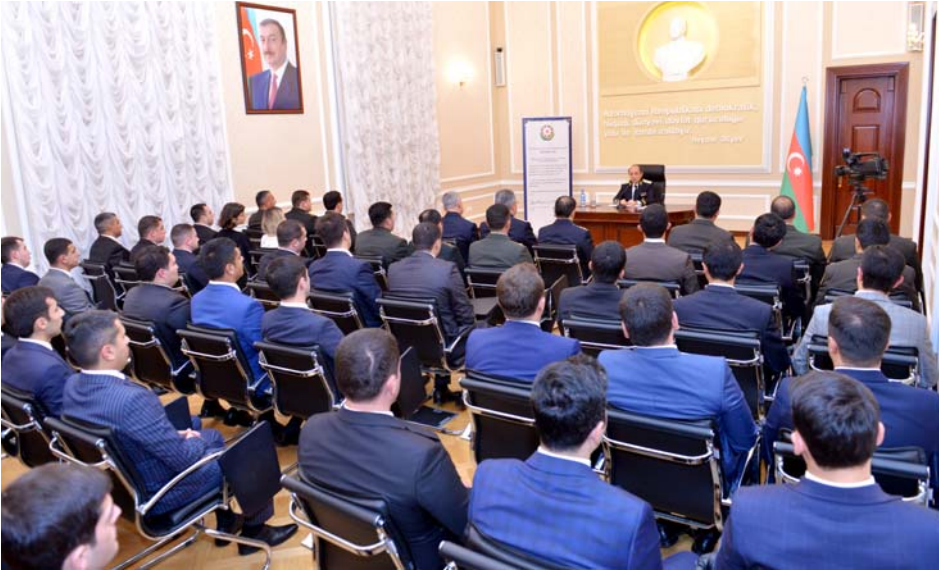
Ədliyyə orqanlarına qulluğa qəbul olunan gənclərlə görüş, noyabr 2017-ci il

olunması diqqət mərkəzində saxlanılaraq müxtəlif bölgələrdə fəaliyyət göstərən notariat orqanlarında çalışmaq istəyən şəxslər üçün müsabiqə elan olunmuş və sənəd vermiş 90 nəfərdən artıq namizədlə bu günlərdə test imtahanı keçiriləcəkdir.