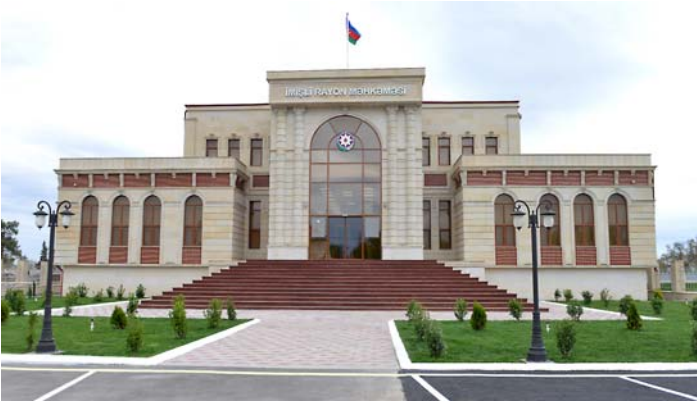
İmişli Rayon Məhkəməsinin yeni binası