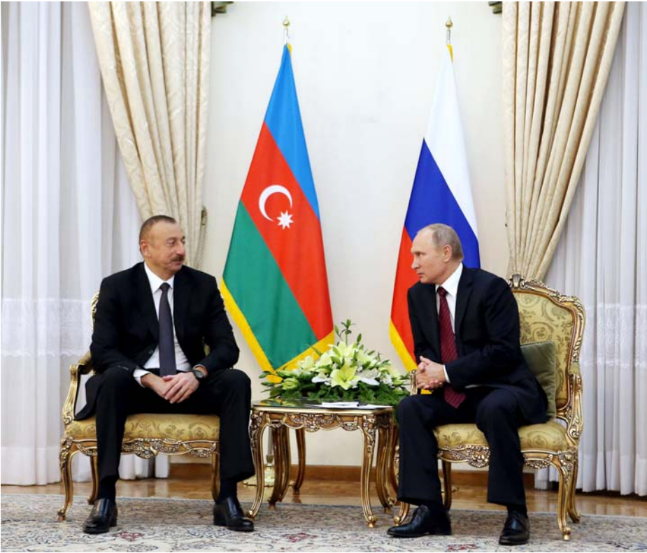
Azərbaycan və Rusiya prezidentlərinin görüşü

Dövlətimizin başçısı İlham Əliyevin və Rusiya Federasiyasının Prezidenti Vladimir Putinin görüşü olub.