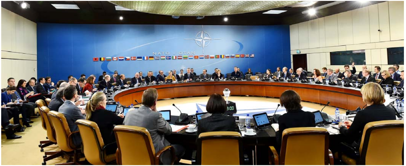
NATO-nun Şimali Atlantika Şurasının iclası