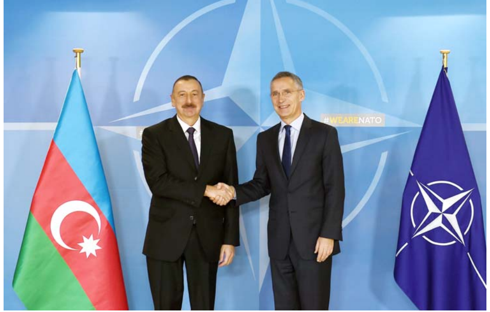
NATO-nun baş katibi Yens Stoltenberq ilə görüş

Azərbaycan ilə Avropa İttifaqı arasında uğurlu əməkdaşlığın həyata keçirildiyi qeyd olunan görüşdə, həmçinin Ermənistan-Azərbaycan, Dağlıq Qarabağ münaqişəsi barədə fikir mübadiləsi aparılıb, danışıqların hazırkı vəziyyəti və perspektivləri barədə məlumat verilib, regional məsələlər müzakirə