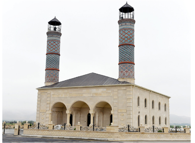
Ölkə Prezidenti cənab İlham Əliyevin Cocuq Mərcanlıda tikdirdiyi Şuşa məscidinin bənzəri olan məscid

Eyni zamanda işğaldan azad edilmiş Cocuq Mərcanlı kəndində dövlət başçısının tapşırıqlarına uyğun olaraq qısa müddətdə görülmüş geniş quruculuq işləri, o cümlədən müasir infrastrukturla, yeni tikilmiş məktəb binası ilə tanış olunub, binada ulu öndər Heydər Əliyevin büstü önünə tər çiçəklər qoyulub, Ədliyyə Nazirliyi tərəfindən məktəb üçün kompüter dəsti hədiyyə edilib. Həmçinin, ölkə Prezidentinin kənddə tikdirdiyi Şuşa Məscidinin bənzəri olan məscid ziyarət olunub.