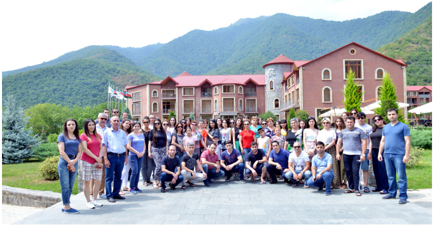
Ədliyyə işçiləri Qax rayonu "El-Resort" istirahət mərkəzində

Bu məqsədlə müxtəlif infoturların, istirahət ekskursiyalarının təşkil olunması ölkəmizi tanımaq və tanımaq, gənc nəslin vətənsəvərliyini və dünyagörüşünü artırmaq baxımından olduqca