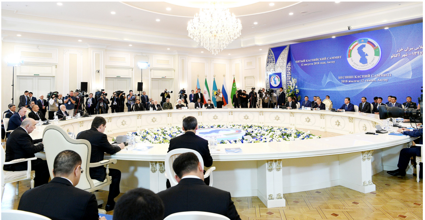
Xəzəryanı dövlətlərin dövlət başçılarının V Zirvə toplantısı

Bildirib ki, Azərbaycan Xəzəryanı ölkələr arasında əməkdaşlığın hüquqi bazasının yaradılmasında fəal iştirak edib. 2010-cu ildə Xəzəryanı ölkələrin dövlət başçılarının Bakıda keçirilmiş III Zirvə