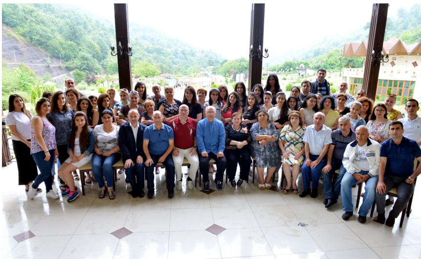
Ədliyyə işçiləri Lerik rayonu "Relaks" istirahət mərkəzində

Şəkidə olarkən nazirliyin kollektivi Azərbaycanın orta əsr memarlığının ən görkəmli və nadir abidələrindən olan Xan Sarayında olmuş, sənətkarlıq, ipəkçilik və ticarətlə məşğul olan karvanların və səyyahların qalması, müxtəlif ticarət əməliyyatlarının aparılması məqsədilə XVIII-XIX əsrlərdə tikilmiş Yuxarı Karvansaray