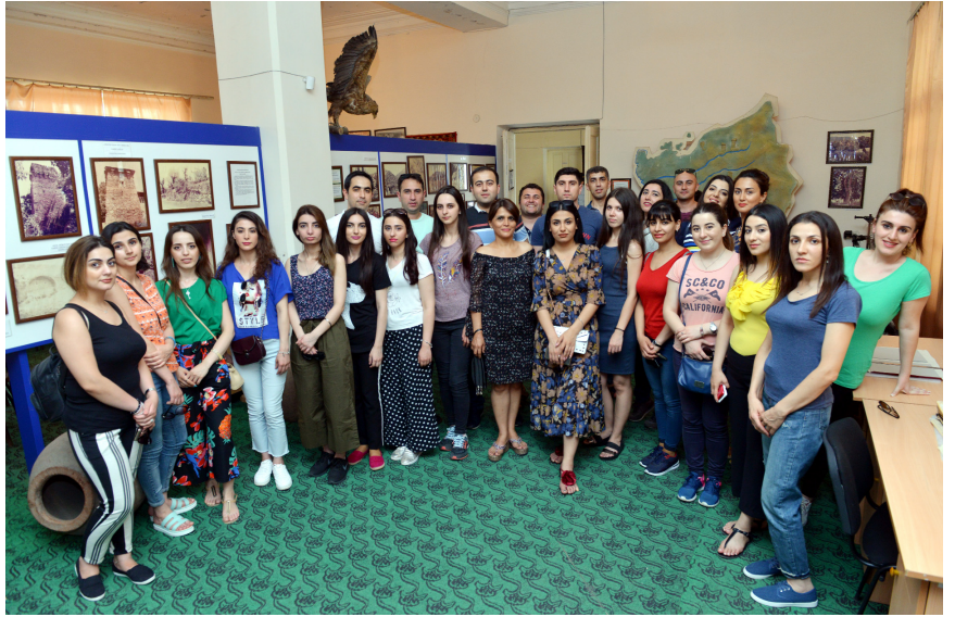
Zaqatala Tarix-Diyarşünaslıq Muzeyi ilə tanışlıq

Nazirliyin əməkdaşları burada asudə vaxtlarını səmərəli və mənalı keçirmiş, müxtəlif idman növləri, o cümlədən voleybol, tennis, boiling və digər oyunlarla məşğul olmuş, musiqili-əyləncəli