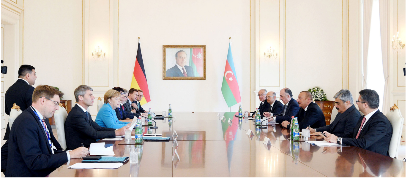
Azərbaycan Prezidenti cənab İlham Əliyevin və Almaniyanın Federal Kansleri xanım Angela Merkelin görüşü