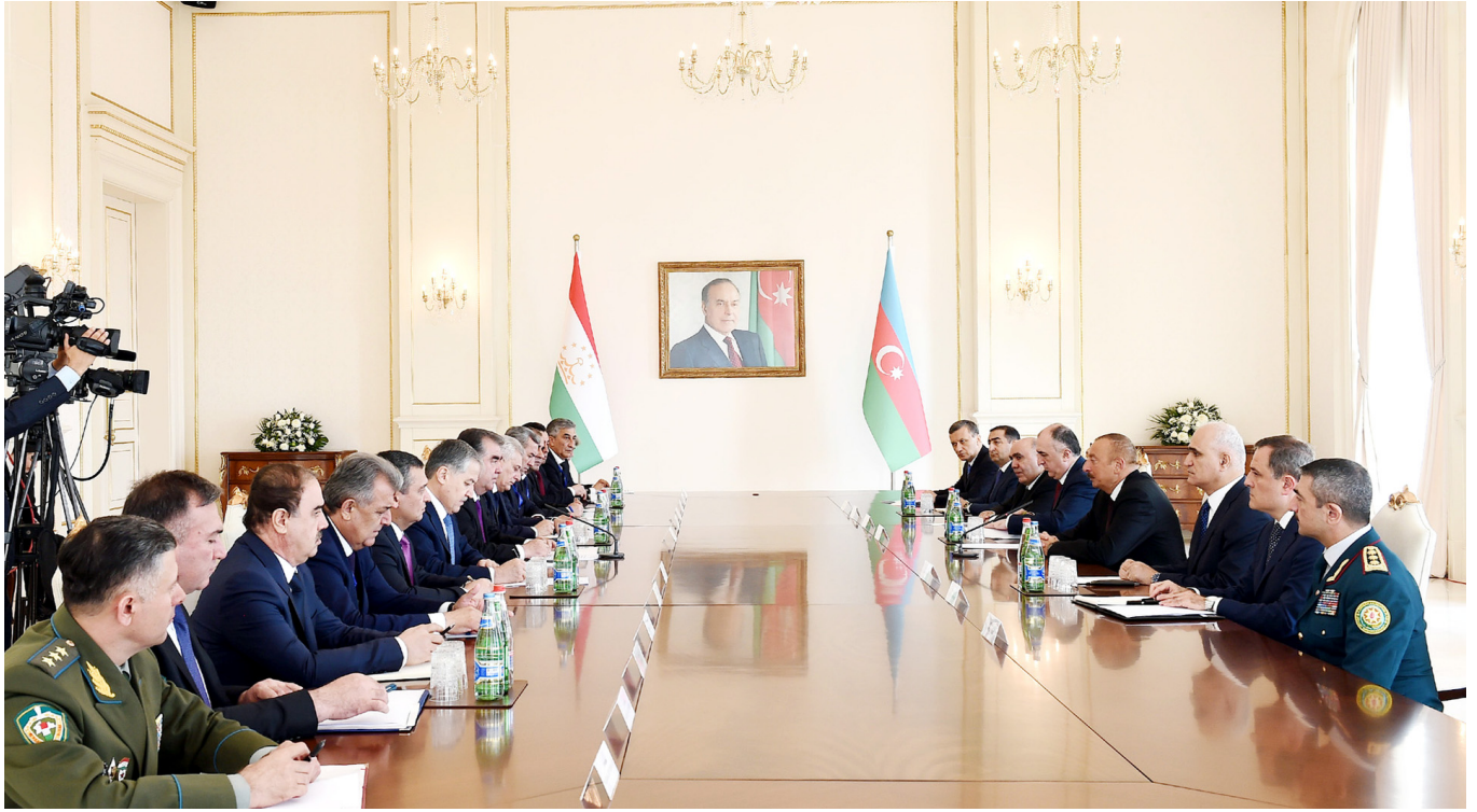
Azərbaycan və Tacikistan prezidentlərinin nümayəndə heyətlərinin iştirakı ilə geniş tərkibdə görüşü

etdirilib, Azərbaycan-Tacikistan sənədləri imzalanıb.