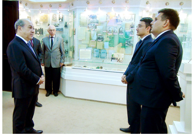
Özbəkistan Ədliyyə Nazirliyinin nümayəndə heyəti ilə görüş

Ölkələrimiz arasında dostluq və səmərəli əməkdaşlıq münasibətlərini qeyd edən nazir müavini dövlət başçısı cənab İlham Əliyevin rəhbərliyi ilə ədliyyə sisteminin inkişafı üzrə aparılan islahatlar, nazirliyin ayrı-ayrı istiqamətləri, o cümlədən qanunverəici fəaliyyəti, qulluğa qəbul, əhaliyə göstərilən elektron xidmətlər, eləcə də Azərbaycan brendi olan və ədliyyənin də müvafiq xidmətlər göstərdiyi "ASAN xidmət" mərkəzlərinin vətəndaş məmnunluğunu təmin edən fəaliyyəti barədə məlumat verib, məhkəmə sisteminin müasirləşdirilməsi üzrə aparılan islahatlardan, hakimlərin