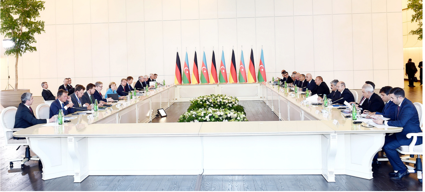
Azərbaycan Prezidentinin və Almaniya Federal Kanslerinin iş adamları ilə görüşü

Dövlətimizin başçısı qeyd edib ki, iki ölkə arasında münasibətlər səmimidir, dostluq münasibətləridir və səfərin də bu münasibətlərin möhkəmlənməsində çox böyük rolu olacaqdır.