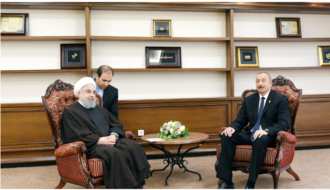
Azərbaycan və İran prezidentlərinin görüşü

Xəzər dənizində mütəşəkkil cinayətkarlığa qarşı mübarizə sahəsində əməkdaşlıq haqqında Protokol, Xəzəryanı dövlətlərin hökumətləri arasında ticari-iqtisadi əməkdaşlıq və nəqliyyat sahəsində əməkdaşlıq haqqında sazişlər, Xəzər dənizində insidentlərin qarşısının alınması haqqında Saziş və sərhad xidməti idarələrinin əməkdaşlığı və qarşılıqlı əlaqələri haqqında Protokol imzalanıb.