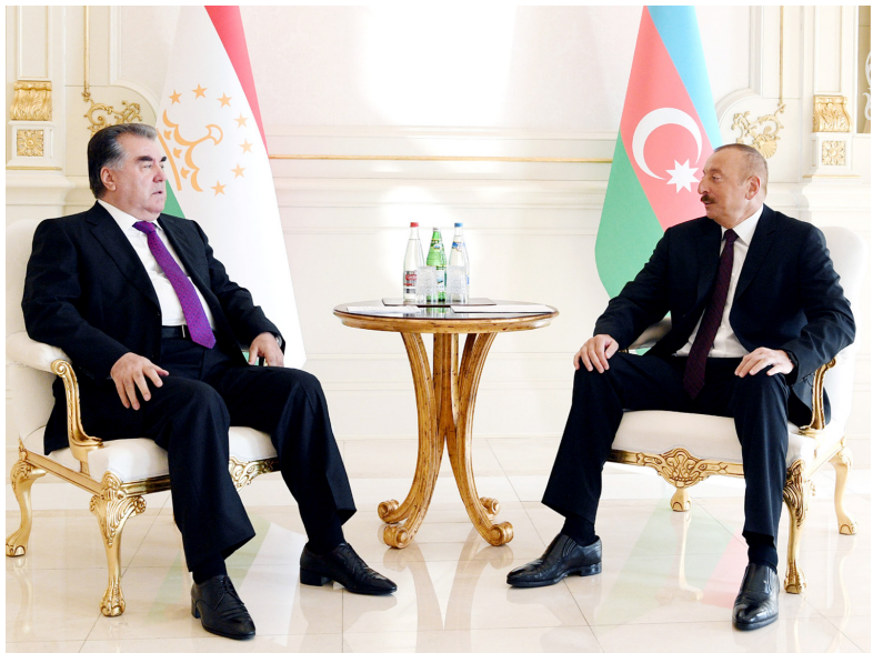
Azərbaycan və Tacikistan prezidentlərinin təkbətək görüşü

Sonra prezidentlərin görüşü nümayəndə heyətlərinin iştirakı ilə geniş tərkibdə davam