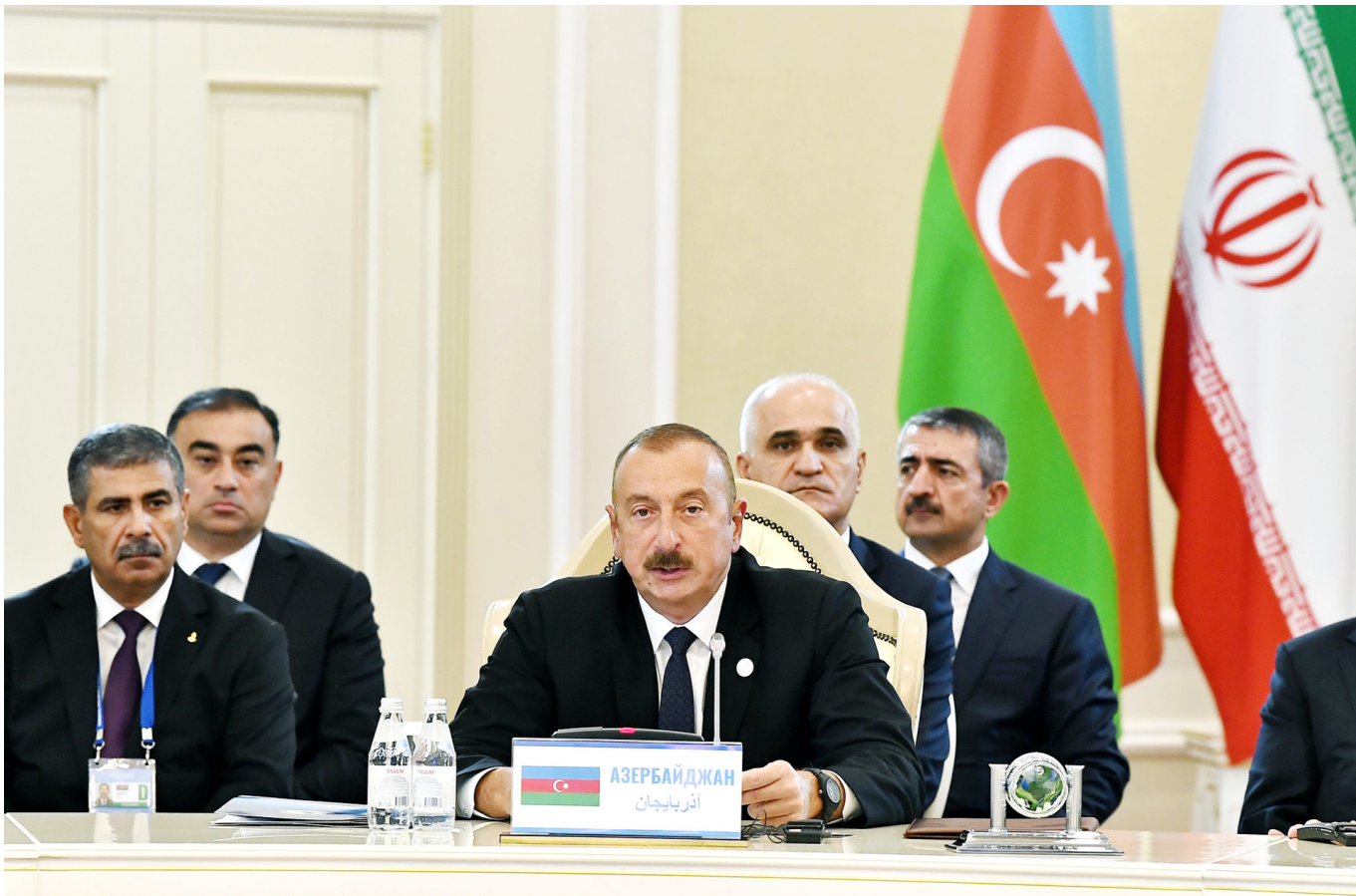
Azərbaycan Prezidenti İlham Əliyevin Xəzəryanı dövlətlərin dövlət başçılarının V Zirvə toplantısında çıxışı

Toplantısı ölkələrimiz arasında sıx əməkdaşlığın möhkəmləndirilməsi işinə mühüm töhfəsini vermişdir. Həmin Zirvə Toplantısında regionda təhlükəsizliyin və sabitliyin qorunub saxlanması baxımından mühüm əhəmiyyət daşıyan "Xəzər dənizində təhlükəsizlik sahəsində əməkdaşlıq haqqında Saziş" imzalanmışdır.