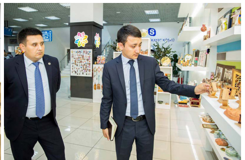
Şəki regional ədliyyə idarəsi, Şəki Məhkəmə Kompleksi və "ASAN xidmət" mərkəzi ilə tanışlıq