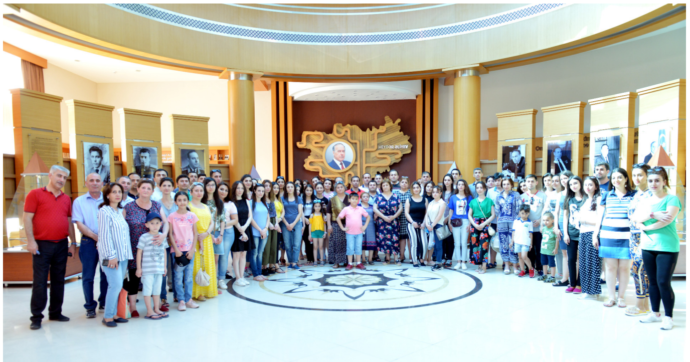
Zaqatala rayonu Heydər Əliyev Mərkəzi ilə tanışlıq

Ədliyyə Nazirliyinin rəhbərliyi tərəfindən əməkdaşların bilik və bacarıqlarının, mənəvi-estetik dünyagörüşlərinin artırılmasına, eləcə də sağlamlığının və fiziki hazırlığının möhkəmləndirilməsinə, asudə vaxtlarının səmərəli təşkilinə daim yüksək diqqət və qayğı ilə yanaşılır, nazirliyin Birləşmiş Həmkarlar İttifaqı Komitəsinin xətti ilə hər il yay mövsümündə ədliyyə işçiləri üçün respublikamızın müxtəlif bölgələrinə maraqlı ekskursiyalar təşkil