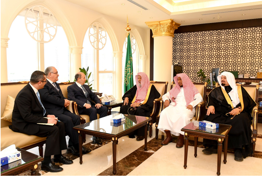
Səudiyyə Ərəbistanı Krallığının Ali Məhkəməsinin sədri və Baş prokuroru ilə görüş