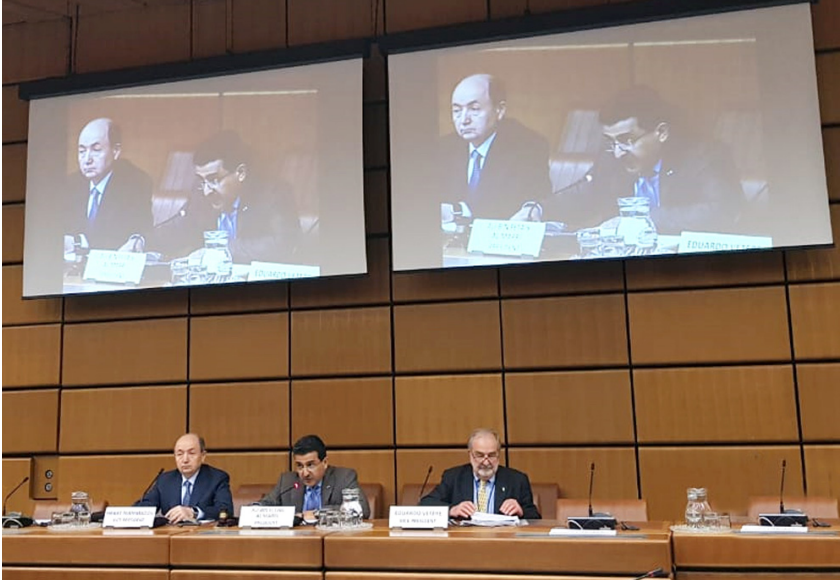
IAACA-nın İcraiyyə Komitəsinin iclası