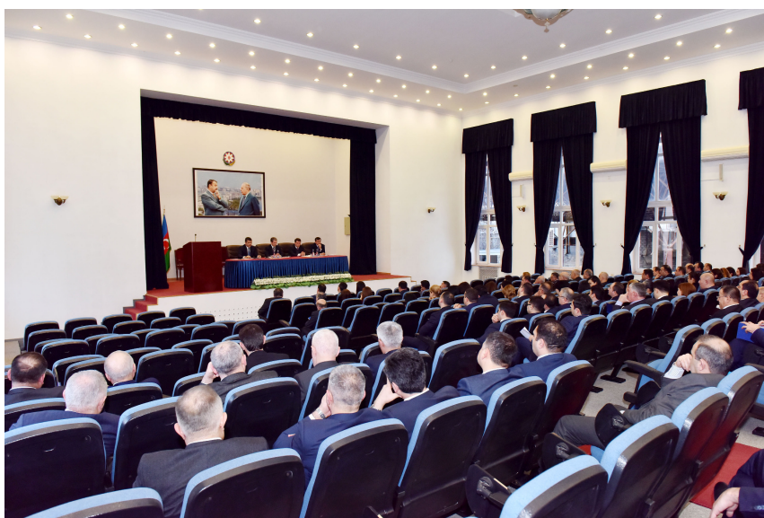
Bakı Apellyasiya Məhkəməsində təlim

Təlimə respublikanın bütün apellyasiya məhkəmələrinin və aidiyyəti kollegiyalarının, inzibati-iqtisadi və paytaxtın rayon məhkəmələrinin sədrləri cəlb olunub. Tədbirdə nazirliyin, o cümlədən Ədliyyə Akademiyasının, habelə Məhkəmə-Hüquq Şurasının məsul işçiləri