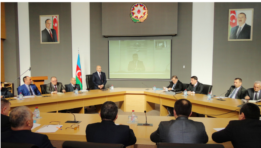
Şəki Apellyasiya Məhkəməsində təlim

Dinləyicilər üçün qanunun düzgün tətbiqində böyük əhəmiyyət kəsb edən belə təlimlər bütün apellyasiya məhkəmələrində, onların yurisdiksiyasına daxil olan məhkəmələrin hakimlərinin iştirakı ilə keçirilib, o cümlədən video-konfranslar təşkil olunub.