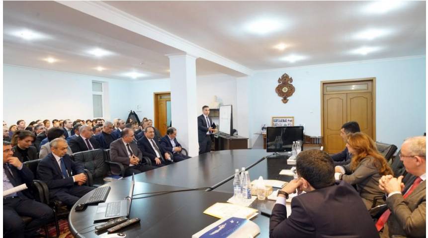
Sumqayıt Apellyasiya Məhkəməsində təlim

Ali və Bakı apellyasiya məhkəmələrinin təlimçi-hakimləri tərəfindən yeni qanunların mahiyyəti, bununla bağlı hakimlərin üzərinə düşən vəzifələr dinləyicilərə aşılıb. Bildirilib ki, dəyişikliklərə əsasən mülki işlər və iqtisadi mübahisələr üzrə məhkəmə icraatının elektron qaydada aparılması, bu zaman proses iştirakçılarının məhkəmə sənədlərinin "Elektron məhkəmə" informasiya sistemi vasitə-