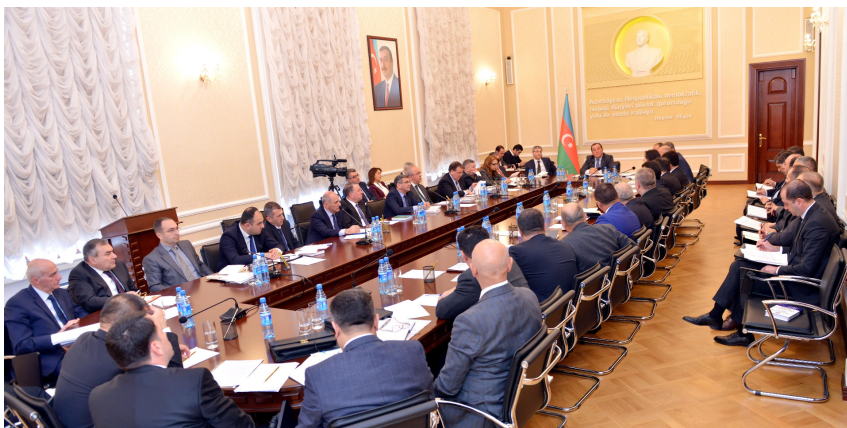
Ədliyyə Nazirliyində təlim

Dövlət başçısının qanunvericilik təşəbbüsü ilə 2018-ci il dekabrın 28-də qəbul olunmuş qanunlarla Mülki Prosesual Məcəllədə və "Məhkəmələr və hakimlər haqqında" Qanunda edilmiş əsaslı dəyi-