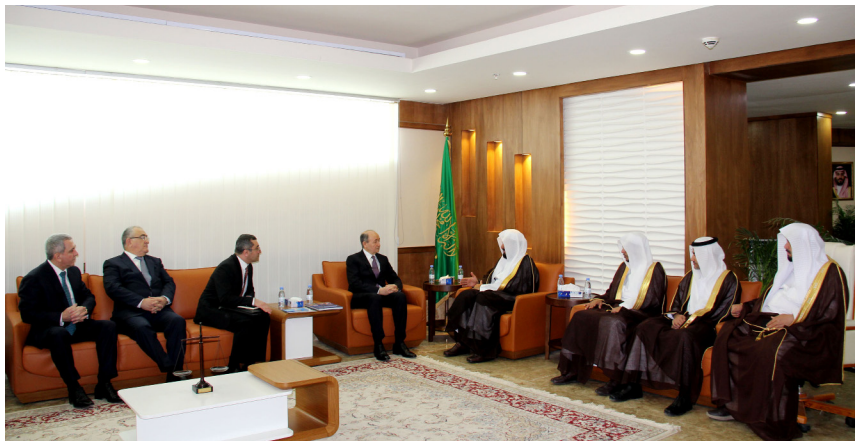
Azərbaycan və Səudiyyə Ərəbistanının ədliyyə nazirlərinin görüşü və iki ölkənin Ədliyyə nazirlikləri arasında əməkdaşlıq haqqında Anlaşma Memorandumunun imzalanması

Həmin sənədin imzalanması məqsədilə Səudiyyə Ərəbistanı Krallığı ədliyyə nazirinin dövlətinə əsasən Azərbay-