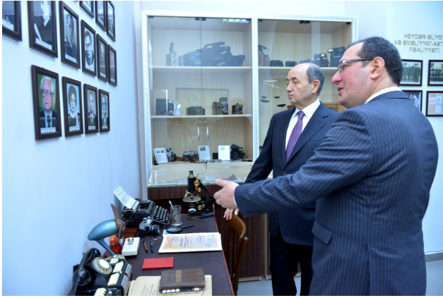
Ədliyyə Akademiyasında yeni yaradılmış Kriminalistik Kabinet ilə tanışlıq

nin ən müasir metodikalar və İKT-lər tətbiq olunmaqla təkmilləşdirilməsi, peşəkar təlimçilərin hazırlanması və təlimlərə beynəlxalq ekspertlərin cəlb olunması, video-konfrans vasitəsilə distant formada treninqlərin təşkili daim diqqətdə saxlanılıb, ötən il 4.300-dək ədliyyə işçisi, vəkillər, hakimlər, prokurorlar və digər hüquqşünaslar, habelə bələdiyyə üzvü və qulluqçuları icbari təlim, ixtisasartırma və peşə hazırlığı kurslarına cəlb olunublar.