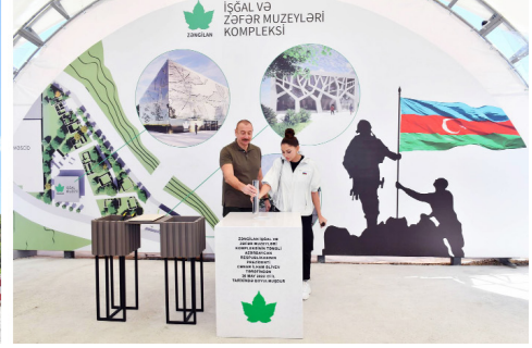
Zəngilan məscidinin tikinti işləri ilə tanışlıq, işğal və Zəfər muzeyləri kompleksinin təməlinin qoyulması