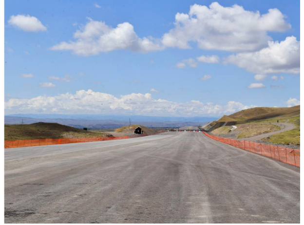
Zəngəzur dəhlizinin tikintisi ilə tanışlıq