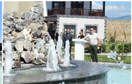
Zəngilan rayonunun Ağalı kəndində "Ağıllı kənd" layihəsinin açılışı

Daha sonra Prezident İlham Əliyevə və birinci xanım Mehriban Əliyevaya Zəngilan şəhərinin Baş planı təqdim olunub. Dövlət başçısı və birinci xanım "sa_partners" şirkətinin nümayəndələri ilə də söhbət edib, Oxçuçayın mənzərəsini seyr ediblər.