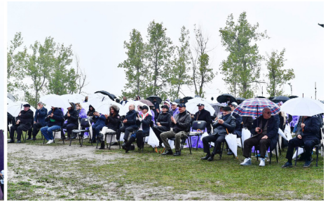
Şuşa şəhəri Cıdır düzündə V "Xarıbülbül" Beynəlxalq Folklor Festivalı