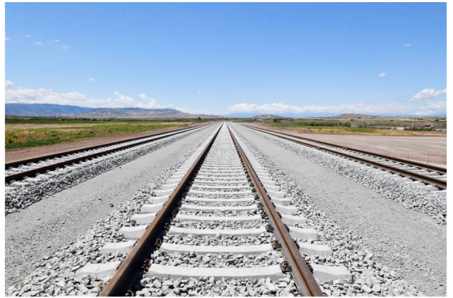
Horadiz-Ağbənd dəmir yolunun Cəbrayıl rayonu ərazisində Soltanlı stansiyasının təməlinin qoyulması

radiz, Mərcanlı, Mahmudlu, Soltanlı, Qumlaq, Həkəri, Mincivan, Bartaz, Ağbənd), 3 tunnelin, 41 körpünün, 7 yolötürücünün, 300-ə yaxın süni mühəndis qurğusunun, rabitə və işarəvermə sisteminin, elektrik təsərrüfatının tikintisi planlaşdırılır. Yol boyunca 85 kilometr ərazi minalardan təmizlənib və proses davam edir. Dəmir yolu xəttinin yan yollarla birlikdə 60 kilometrlik hissəsi tamamlanıb.