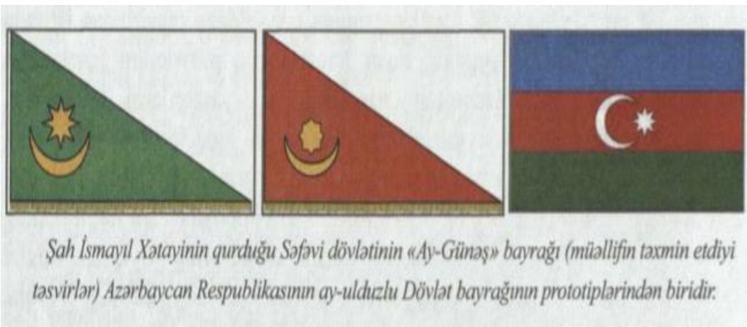
Şah İsmayıl Xətayinin qurduğu Səfəvi dövlətinin «Ay-Günəş» bayrağı (müəllifin təxmin etdiyi təsvirlər) Azərbaycan Respublikasının ay-ulduzlu Dövlət bayrağının prototiplərindən biridir.