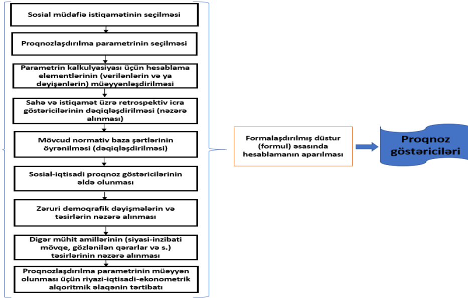
Şəkil 1. Sosial müdafiədə proqnozlaşdırılma prosesinin konseptual təsviri (müəllif tərəfindən tərtib edilmişdir)

Bütövlükdə sosial müdafiə sahəsinin tərkib strukturu nəzərə alınmaqla sosial müdafiənin proqnozlaşdırılmasının amilləri mühitini aşağıdakı sxematik təsvirlə vermək mümkündür (şəkil 1):