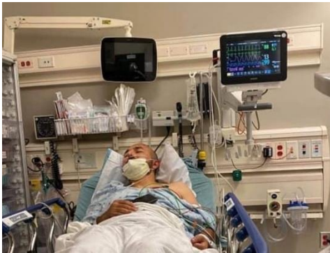
Ağır xəsarətlər almış B.E.

Müsaibə etdiyimiz 11 şahiddən səkkizi döyüldüyünü və onlardan dördünün xəsarət aldığını qeyd ediblər. Bütün şahidlər hücum zamanı ermənilərin təpiklər və yumruqlardan istifadə etdiklərini, əsasən bir-iki azərbaycanlıya qrup şəklində hücum etdiklərini bildirdi.