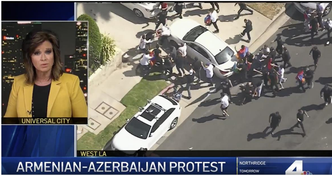
Armenians and Azerbaijanis clash outside the consulate of Azerbaijan in Los Angeles on July 21.