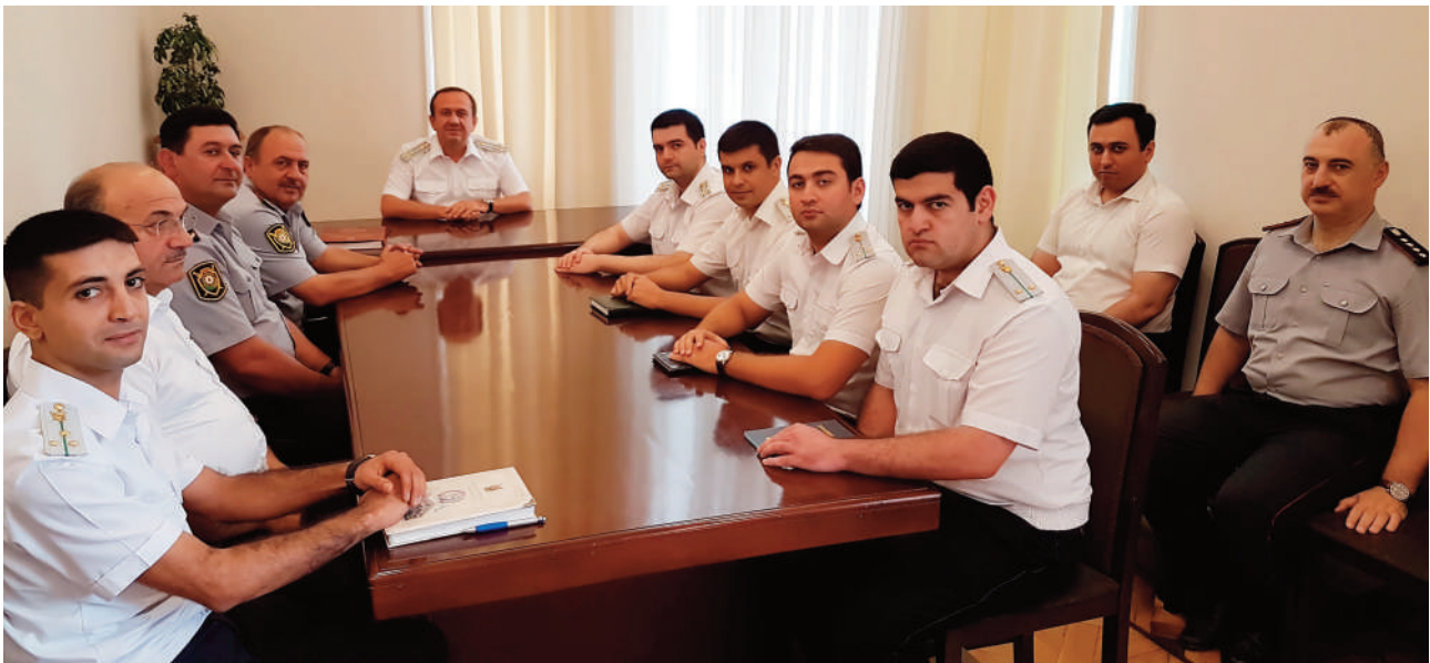
Bakı şəhəri, Səbail rayon prokurorluğunda keçirilmiş tədbirin iştirakçıları