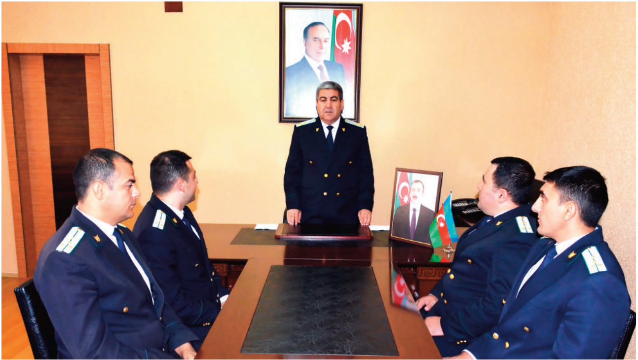
Babək rayon prokurorluğunda keçirilmiş tədbirin iştirakçıları

Tədbirlərdə Azərbaycan Respublikası Prokurorluğunun keçdiyi tarixi inkişaf yolu barədə məlumatlar verilib.