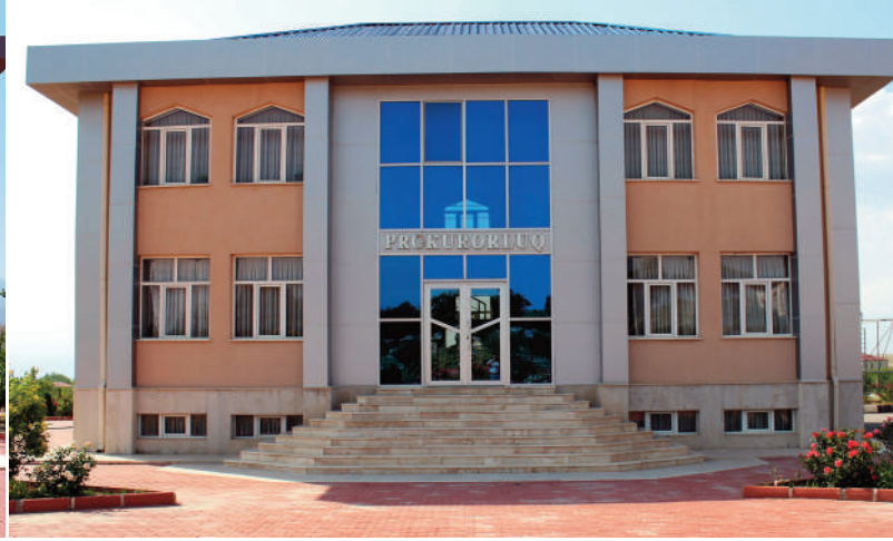
Kəngərli rayon prokurorluğunun inzibati binası