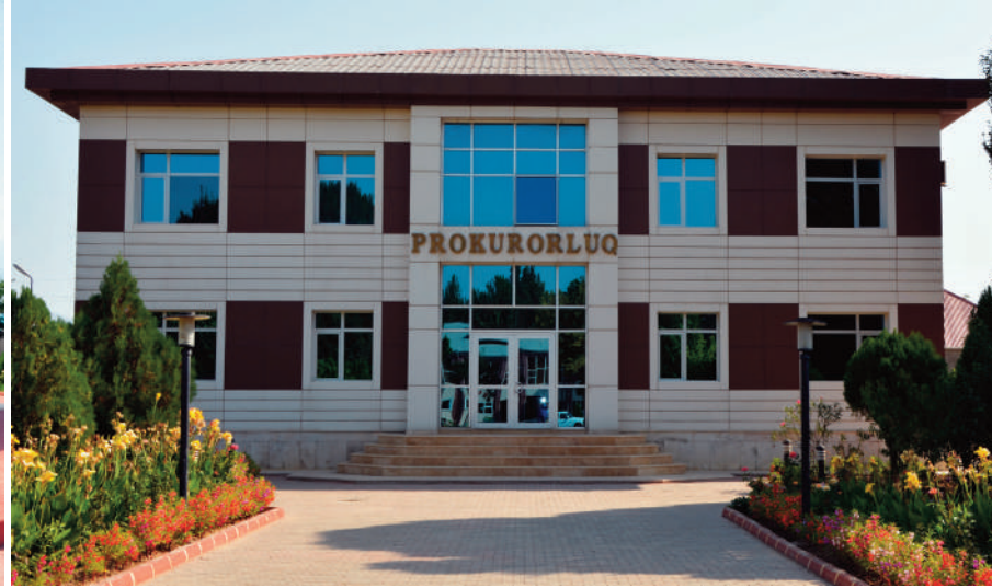
Şərur rayon prokurorluğunun inzibati binası