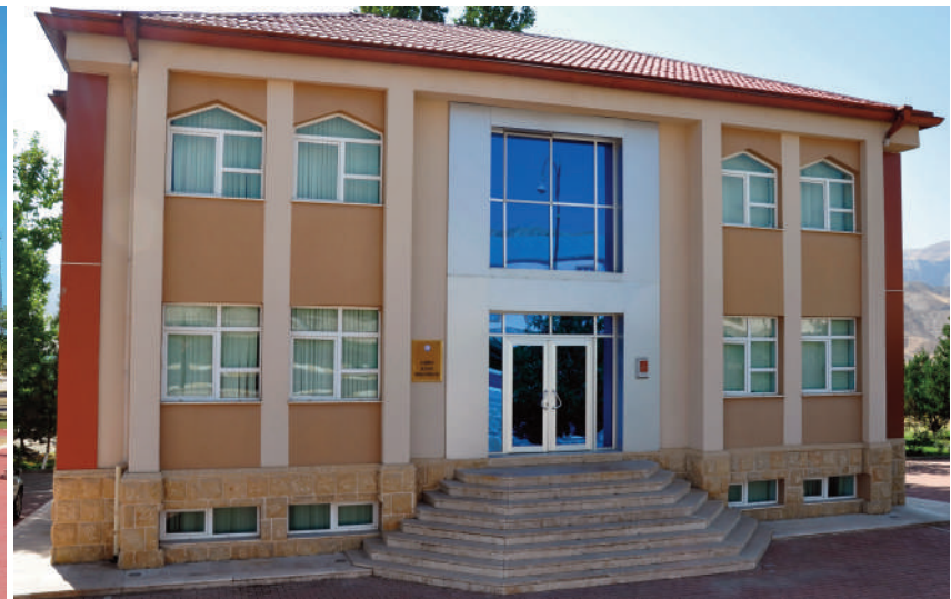
Şahbuz rayon prokurorluğunun inzibati binası