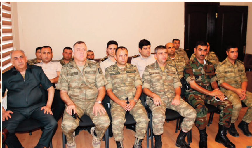
Qarabağ hərbi prokurorluğunda keçirilmiş tədbirin iştirakçıları