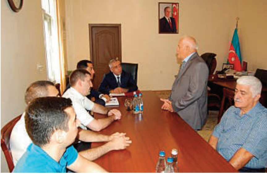
Bakı şəhəri, Binaqadi rayon prokurorluğunda keçirilmiş tədbirin iştirakçıları

olunub, rayon prokurorluqlarının bir sıra işçiləri rayon İcra Hakimiyyəti başçılarının fəxri fərmanları və xatirə hədiyyələri ilə təltif olunublar.