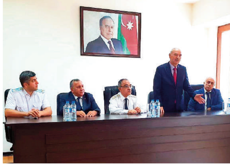
Bakı şəhəri, Yasamal rayon prokurorluğunda keçirilmiş tədbirin iştirakçıları