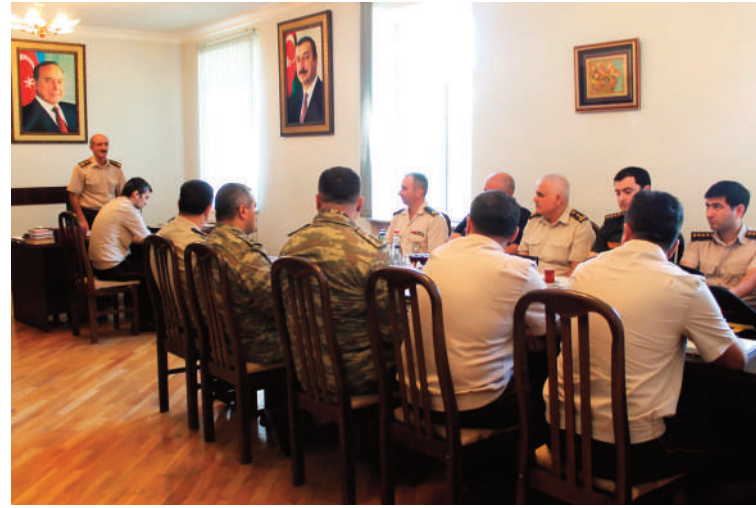
Sumqayıt hərbi prokurorluğunda keçirilmiş tədbirin iştirakçıları