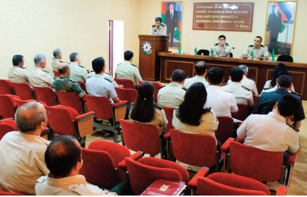
Bakı hərbi prokurorluğunda keçirilmiş tədbirin iştirakçıları