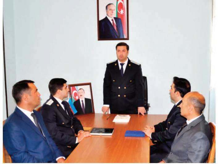
Şahbuz rayon prokurorluğunda keçirilmiş tədbirin iştirakçıları