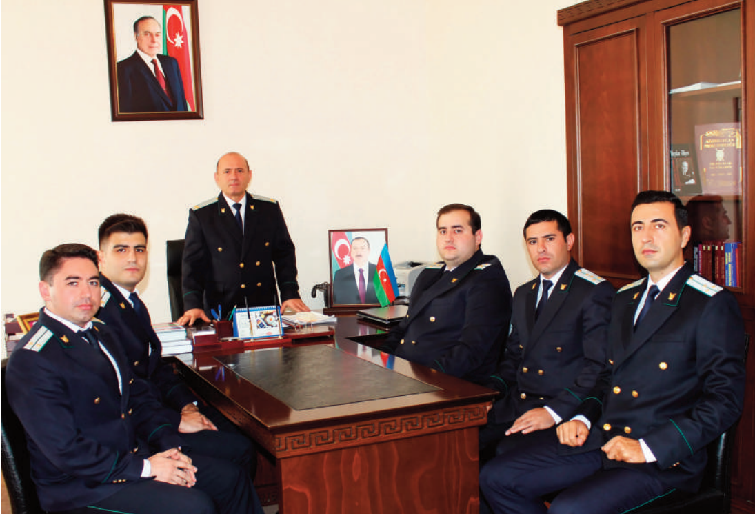
Naxçıvan şəhər prokurorluğunda keçirilmiş tədbirin iştirakçıları

Azərbaycan Prokurorluğunun yaranmasının 100 illik yubileyi münasibətilə avqustun 28-də Naxçıvan şəhər prokurorluğunda, sentyabrın 4-də Babək rayon prokurorluğunda, sentyabrın 12-də Culfa rayon prokurorluğunda, sentyabrın 14-də Kəngərli, Şahbuz, Şərur rayon prokurorluqlarında, sentyabrın 15-də Sədərək rayon prokurorluğunda, sentyabrın 17-də Ordubad rayon prokurorluğunda seminarlar keçirilib.