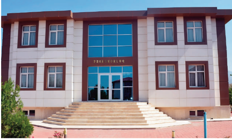
Sadarak rayon prokurorluğunun inzibati binası