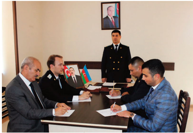
Ordubad rayon prokurorluğunda keçirilmiş tədbirin iştirakçıları