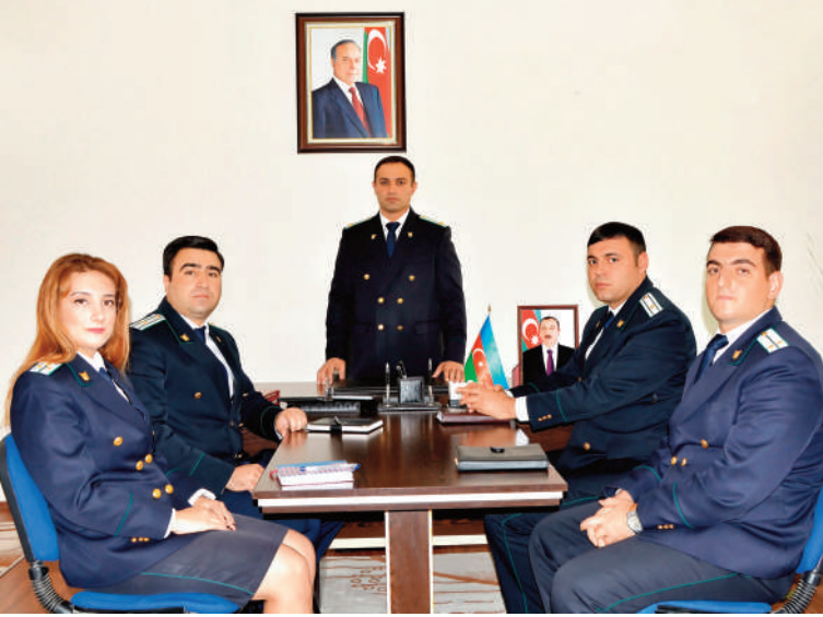
Şarur rayon prokurorluğunda keçirilmiş tədbirin iştirakçıları