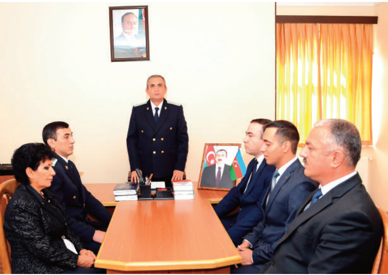
Culfa rayon prokurorluğunda keçirilmiş tədbirin iştirakçıları