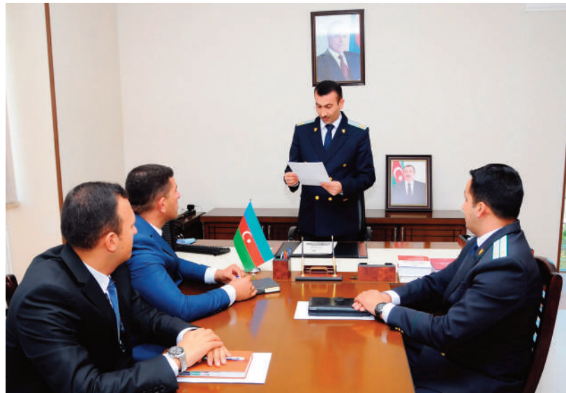
Kəngərli rayon prokurorluğunda keçirilmiş tədbirin iştirakçıları Naxçıvan Muxtar Respublikasının Prokurorluğu