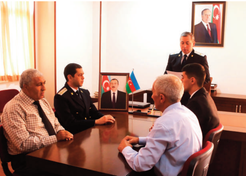
Sadərak rayon prokurorluğunda keçirilmiş tədbirin iştirakçıları