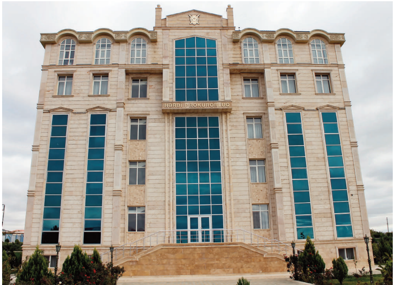
Naxçıvan Muxtar Respublikası Hərbi Prokurorluğunun inzibati binası