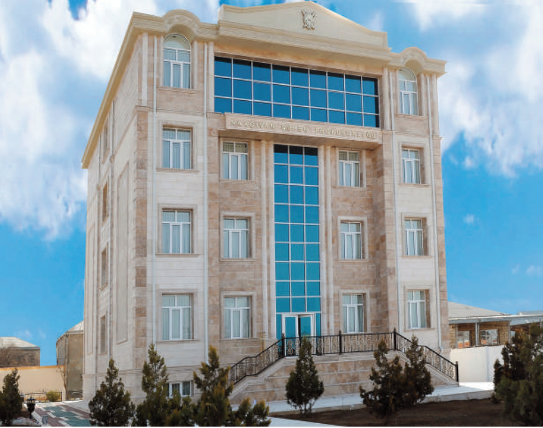
Naxçıvan şəhər prokurorluğunun inzibati binası