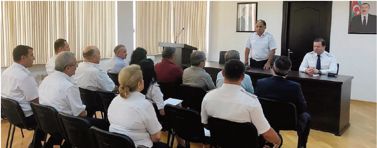
Bakı şəhəri, Sabunçu rayon prokurorluğunda keçirilmiş tədbirin iştirakçıları