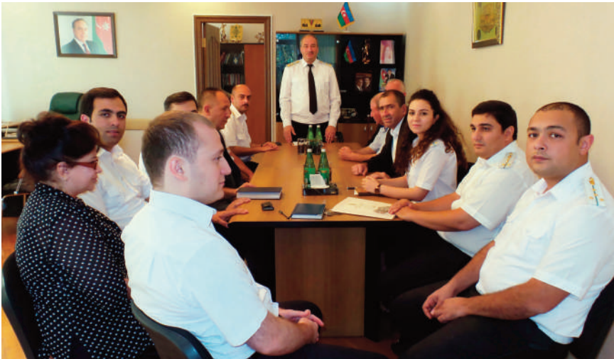
Bakı şəhəri, Suraxanı rayon prokurorluğunda keçirilmiş tədbirin iştirakçıları