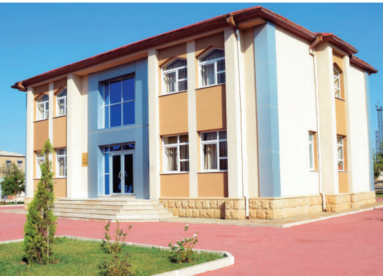
Culfa rayon prokurorluğunun inzibati binası