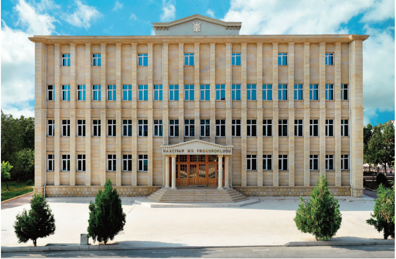
Naxçıvan Muxtar Respublikası Prokurorluğunun inzibati binası