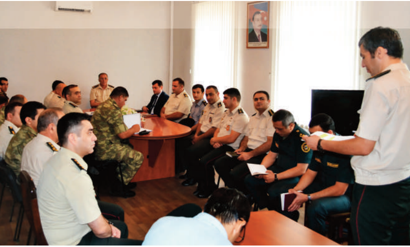
Gəncə hərbi prokurorluğunda keçirilmiş tədbirin iştirakçıları