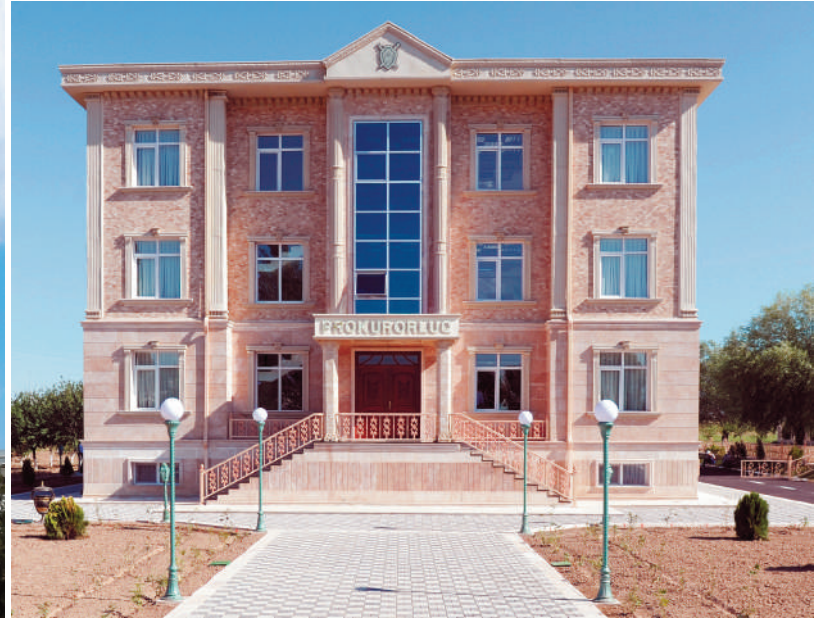
Babək rayon prokurorluğunun inzibati binası