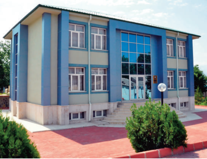
Ordubad rayon prokurorluğunun inzibati binası