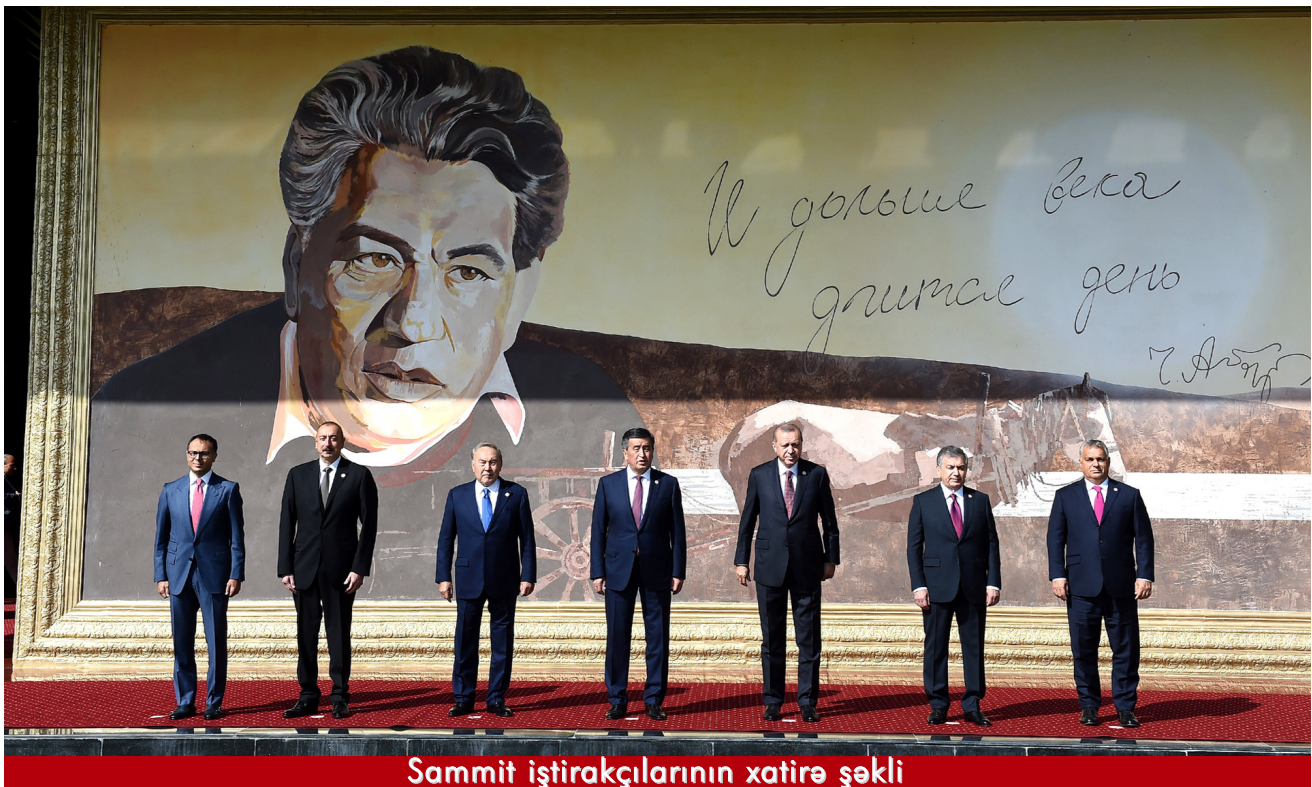
Sammit iştirakçılarının xatirə şəkli

Səfər zamanı Çolpon-Ata şəhərində Qırğız Respublikasının Prezidenti Sooronbay Jeenbekovun adından Türkdilli Dövlətlərin Əməkdaşlıq Şurasına üzv olan dövlətlərin başçılarının şərəfinə rəsmi ziyafət verilib. Azərbaycan Respublikasının Prezidenti İlham Əliyev ziyafətdə iştirak edib.