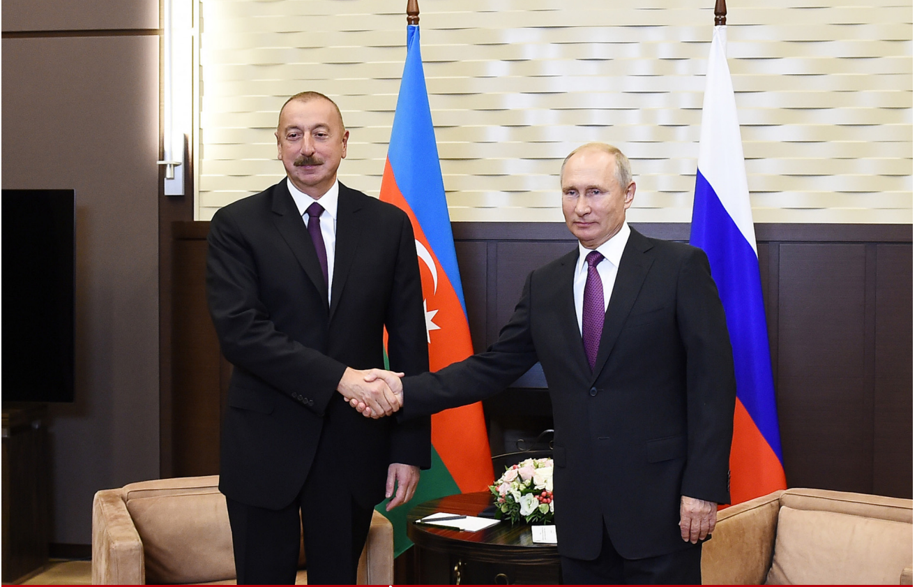
Azərbaycan Prezidenti İlham Əliyevin Rusiyaya rəsmi səfəri