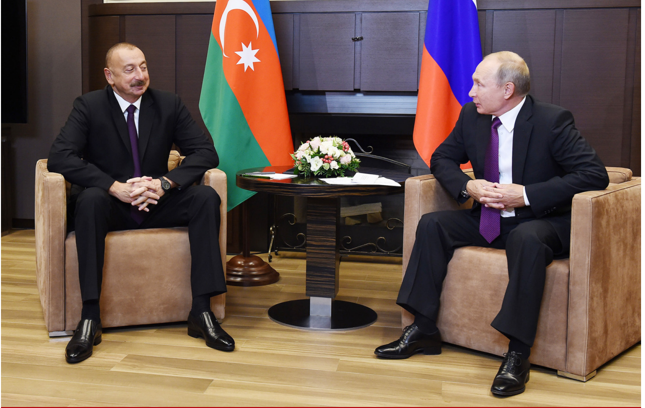
Azərbaycan və Rusiya prezidentlərinin görüşü