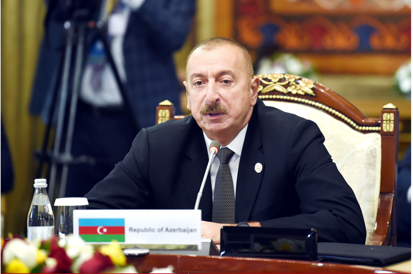
Azərbaycan Prezidenti İlham Əliyevin Sammitdə çıxışı

həm ölkələrimizin ümumi inkişafına töhfə verəcəyinə, eyni zamanda, bizim əməkdaşlığımızı daha da möhkəmləndirəcəyinə əminliyini ifadə edib.