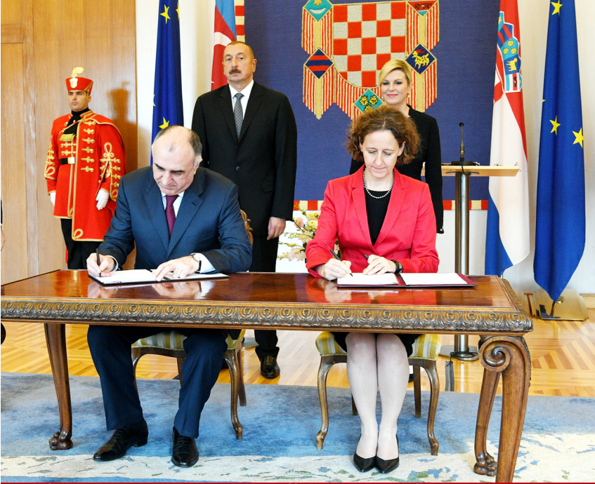
Azərbaycan-Xorvatiya sənədlərinin imzalanması mərasimi

ciddi fəaliyyət göstərəcəyini hesab edib.