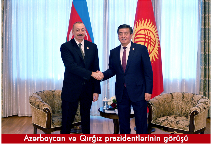
Azərbaycan və Qırğız prezidentlərinin görüşü

Qırğızistanın mirvarisi olan İssık-Kula səfər etməsindən məmnunluğunu ifadə edən dövlətimizin başçısı burada təşkil olunan Türkdilli Dövlətlərin Əməkdaşlıq Şurasının Sammitinin birliyimizi, əməkdaşlığımızı təsdiq edən, həmçinin ikitərəfli münasibətlərimizi müzakirə etmək üçün yaxşı imkan yaranan əhəmiyyətli tədbir olmasına əminliyini bildirib, Qırğı-