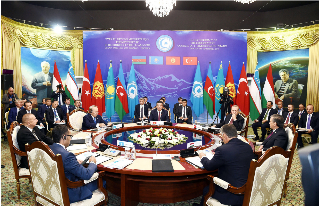
Türkdilli Dövlətlərin Əməkdaşlıq Şurasının VI Sammiti

mövzusunun milli idman növlərinin və gənclər arasında əməkdaşlığın inkişafı ilə bağlı olduğunu bildirib, Şura qarşısında bir sıra vacib məsələlərin dayandığını, türkdilli dövlətlər arasında turizmin inkişafının əhəmiyyətini qeyd edib.