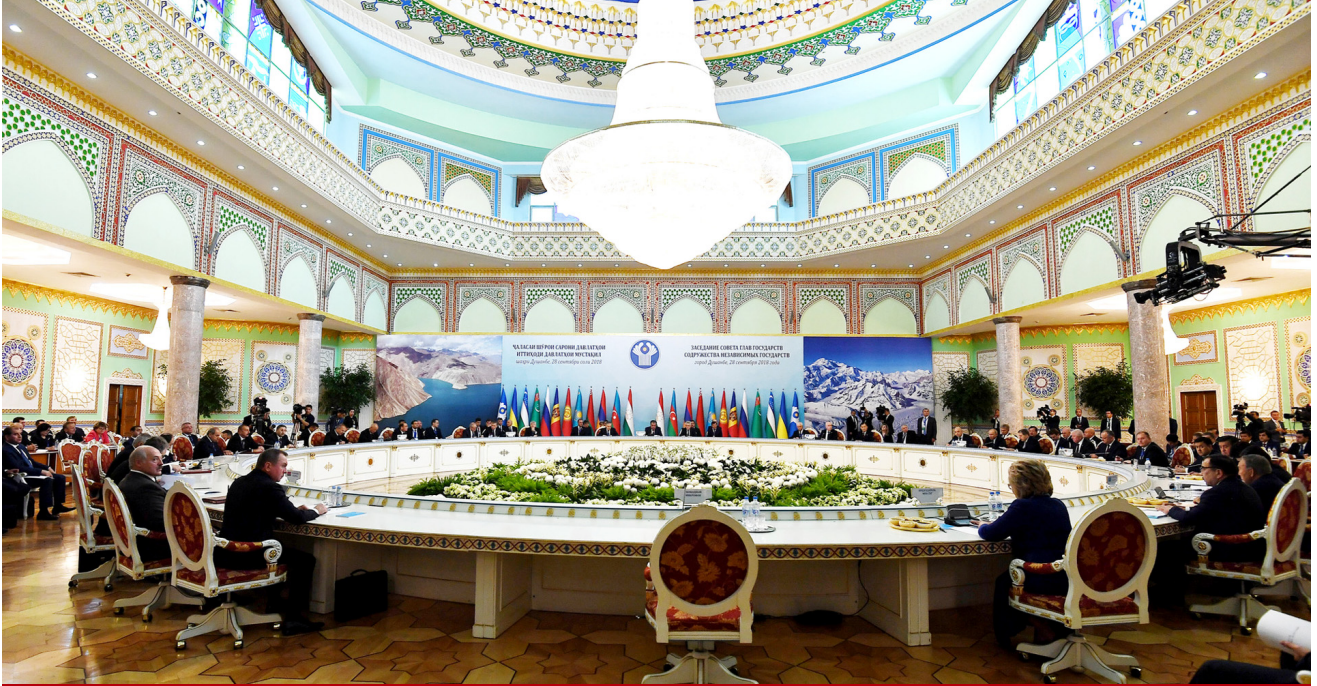
MDB Dövlət Başçıları Şurasının geniş tərkibdə görüşü

açıq elan edib. Sonra MDB İcraiyyə Komitəsinin sədri-icraçı katib Sergey Lebedev Şura iclasının gündəliyi barədə məlumat verib.