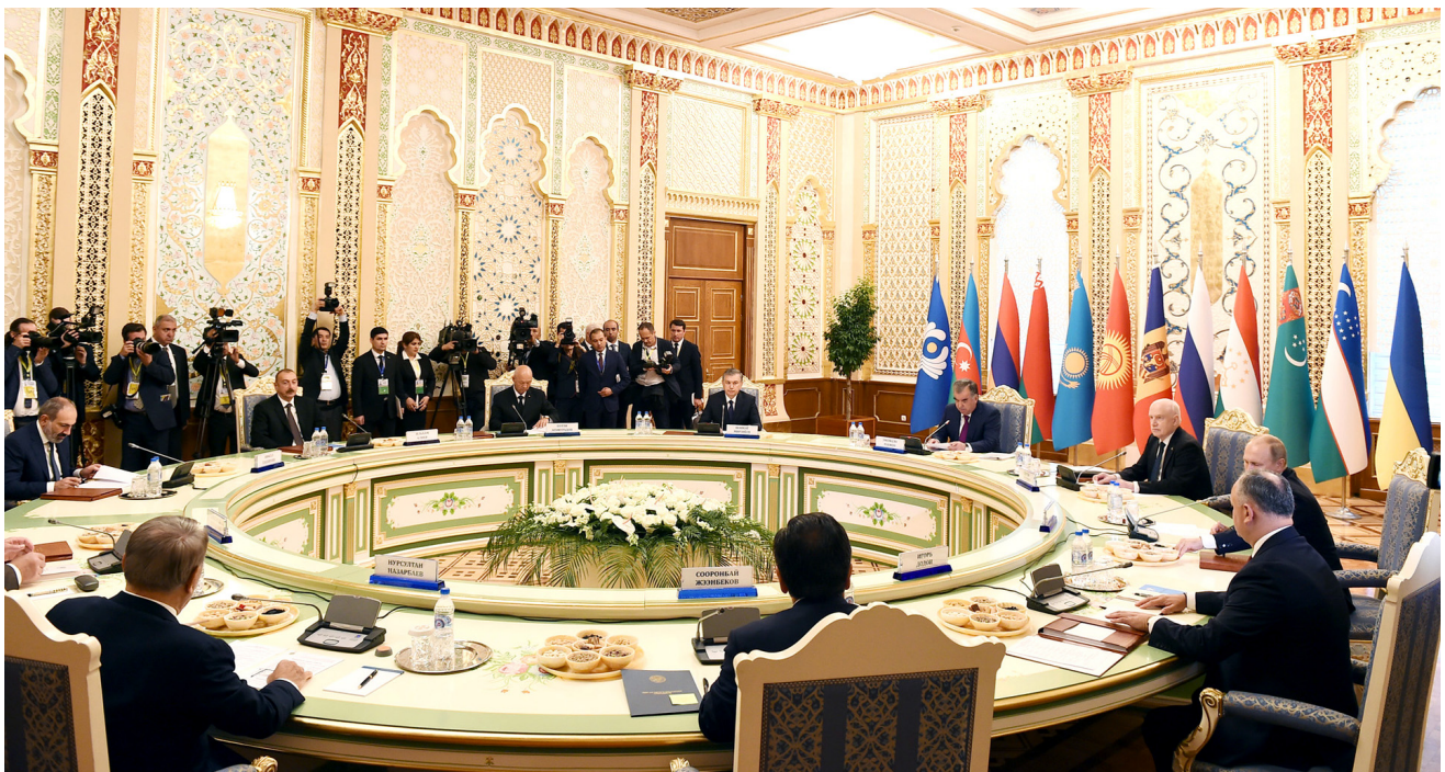
MDB Dövlət Başçıları Şurasının məhdud tərkibdə görüşü