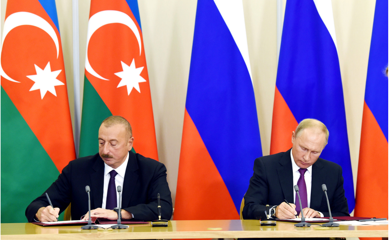
Azərbaycan-Rusiya sənədlərinin imzalanması mərasimi

qeydiyyatı və kadastr fəaliyyəti sahəsində əməkdaşlıq haqqında Saziş və Rusiya-Azərbaycan əməkdaşlığının başlıca istiqamətlərinin inkişafı üzrə Fəaliyyət Planı imzalanıb.