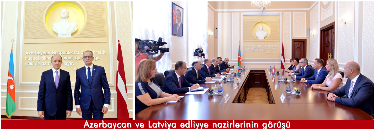
Azərbaycan və Latviya ədliyyə nazirlərinin görüşü

Ö lkə Prezidenti İlham Əliyevin rəhbərliyi ilə aparılan hüquqi islahatlar çərçivəsində qabaqcıl xarici təcrübələrin öyrənilməsinə, beynəlxalq əlaqələrin inkişafına böyük önəm verilərək xarici ölkələrin, o cümlədən Avropa İttifaqı dövlətlərinin ədliyyə qurumları ilə səmərəli əməkdaşlıq həyata keçirilir. 2017-ci ildə Azərbaycan və Latviya Ədliyyə nazirlikləri arasında əməkdaşlığa dair Anlaşma