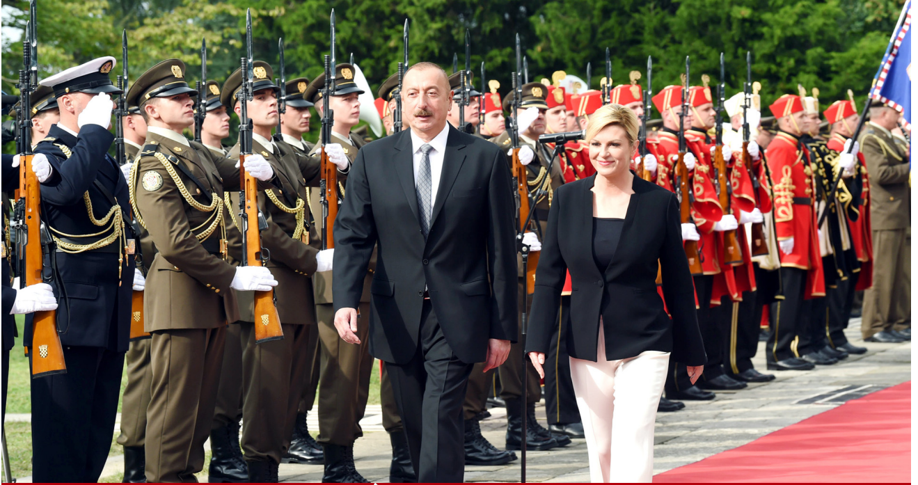
Azərbaycan Prezidenti İlham Əliyevin Xorvatiyaya rəsmi səfəri