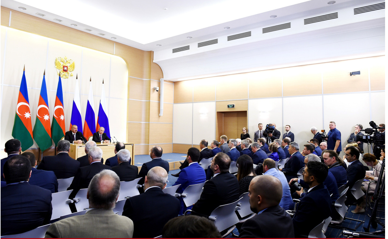
Azərbaycan və Rusiya prezidentlərinin mətbuata bəyanatla çıxışları

olunmuş razılaşmaların Rusiya-Azərbaycan dostluğunun daha da möhkəmlənməsinə xidmət edəcəyinə, ölkələrimizin və xalqlarımızın rifahı naminə qarşılıqlı faydalı əməkdaşlığın inkişafına kömək göstərəcəyinə əminliyini ifadə edib.