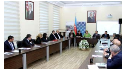
Ədliyyə Akademiyasında hakimlər üçün təqdimat

na Konstitusiyasında dəyişikliklər" mövzusunda təqdimatı olub.