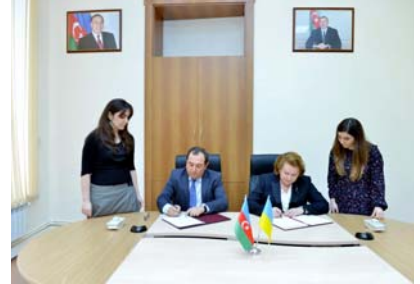
Ədliyyə Akademiyası və Ukrayna Hakimlərinin Milli Məktəbi arasında əməkdaşlığa dair Memorandumun imzalanması