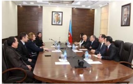
Məhkəmə-Hüquq Şurasında görüş