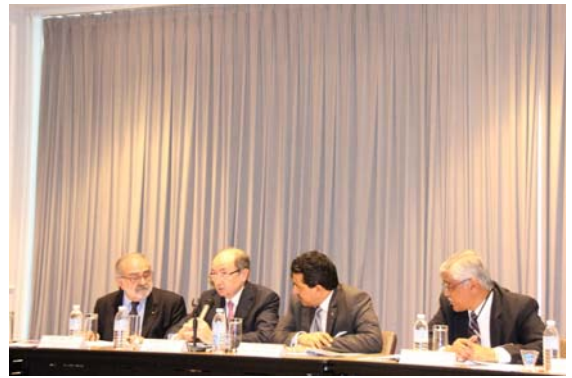
IAACA İcraiyyə Komitəsinin iclası

yəti barədə məlumat verilib, müzakirə olunan məsələlərə dair bir çox təkliflər irəli sürülüb və yekdilliklə qəbul olunub.