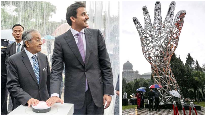
Malayziyanın Putracaya şəhərində "Korrupsiyaya yox" heykəlinin açılış mərasimi