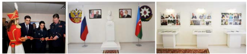
Ryazan Hüquq və İdarəetmə Akademiyasının binasında Rusiya-Azərbaycan dostluğu guşəsinin açılışı

təkmilləşdirilməsi, dövlət başçısının cəza siyasətinin humanistləşdirilməsinə dair 10 fevral 2017-ci il tarixli Sərəncamı ilə bağlı görülmüş işlər, o cümlədən ölkəmizdə Probasiya xidmətinin təşkili, azadlığın məhdudlaşdırılması yeni cəza növünün icrası, bu zaman elektron nəzarət vasitələrindən istifadə edilməsi barədə ətraflı məlumat verilib.