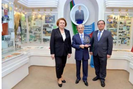
Ədliyyə Nazirliyində görüş