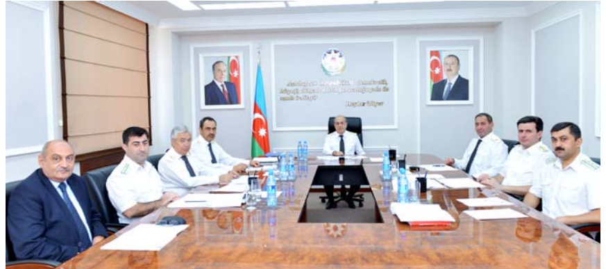
Müsəbiqə Komissiyasının iclası

Hüquqşünas alimlərin və qeyri-hökumət təşkilatlarının nümayəndələrinin də iştirak etdiyi bu mərhələdə 82 nəfər zəruri bal toplayaraq söhbətdən