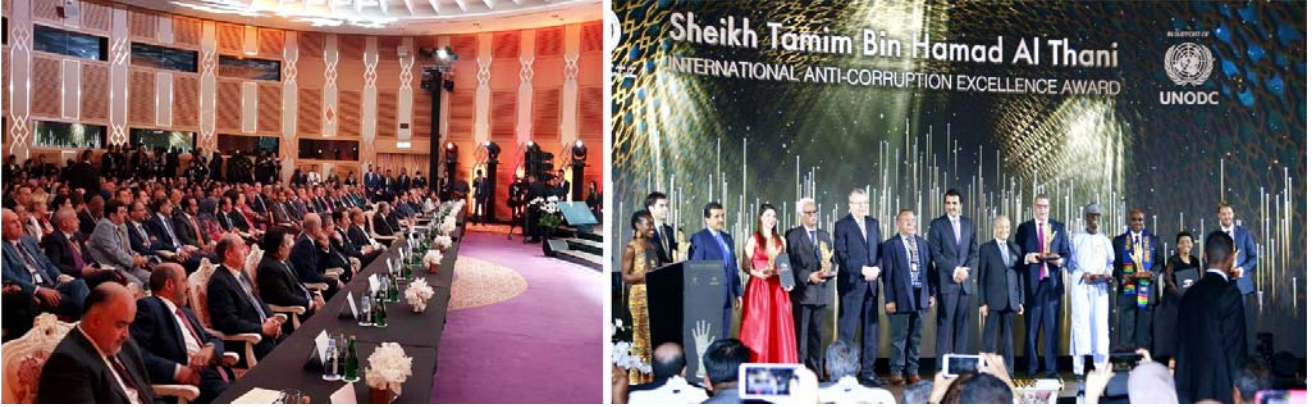
Beynəlxalq Antikorrupsiya təltifinin təqdimatı mərasimi