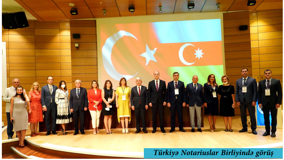
Türkiyə Notariuslar Birliyində görüş

verilən məlumatlar tədbir iştirakçıları tərəfindən maraqla qarşılıb və onların çoxsaylı sualları cavablandırılıb.