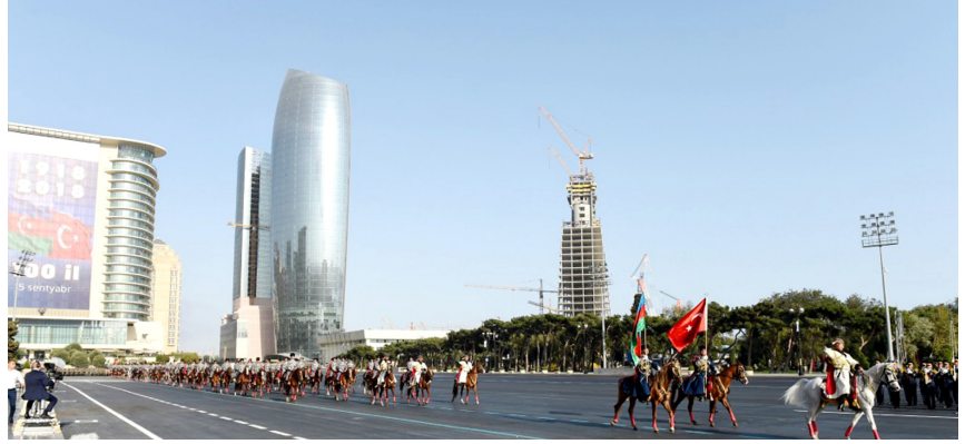
Bakı, 15 sentyabr 2018-ci il. Bakının azad edilməsinin 100 illiyinə həsr olunmuş parad

Bolşevik Rusiyası Birinci Dünya müharibəsindən çıxdıqdan sonra geri çəkilən rus ordusu ilə birlikdə erməni silahlı dəstələri də Cənubi Qafqaza gəldilər. Rusiya hərbiçiləri silahlarını həmin vaxta qədər Anadoluda, Borçalıda, İrəvan quberniyasında, Cənubi Azərbaycan və indiki Azərbaycan Respublikası ərazisində qanlar tökən erməni bəndalarına vermişdilər. Həmin vaxt Bakıda qurulan sovet hakimiyyəti dinc türk-müsəlman əhaliyə zülm edirdi. 1918-ci ilin martında Bakıda və Azərbaycanın digər yerlərində azərbaycanlılara qarşı törədilən soyqırımını