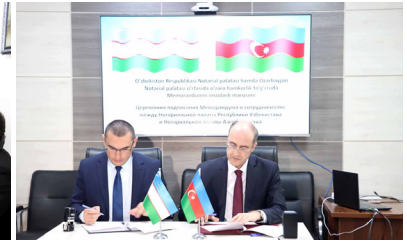
Azərbaycan-Özbəkistan Notariat palataları arasında Memorandumun imzalanması

Özbəkistan Notariat Palatasının hazırladığı "Özbəkistan notariuslarının fəaliyyətində informasiya texnologiyalarından