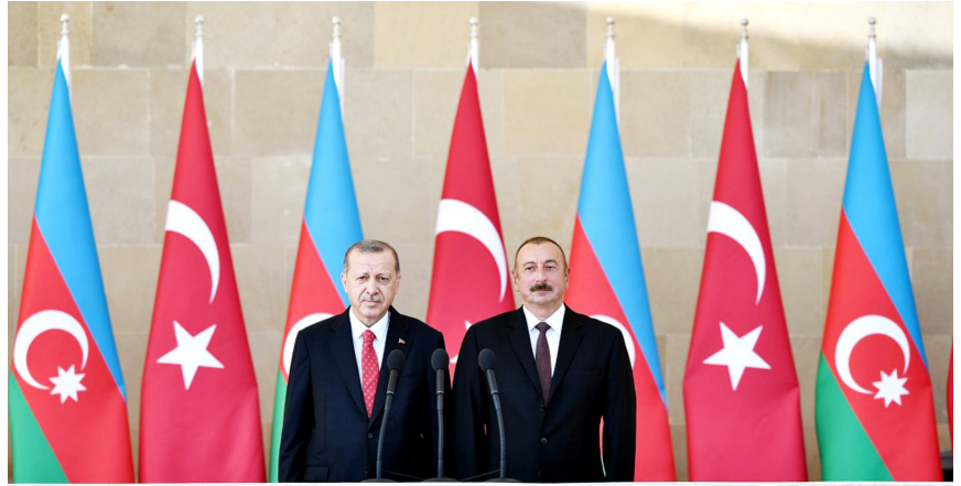
Azərbaycan və Türkiyə prezidentləri paradda

nın qarşısını nə Transqafqaz Komissarlığı, nə də Transqafqaz Seymi ala bilmədi.