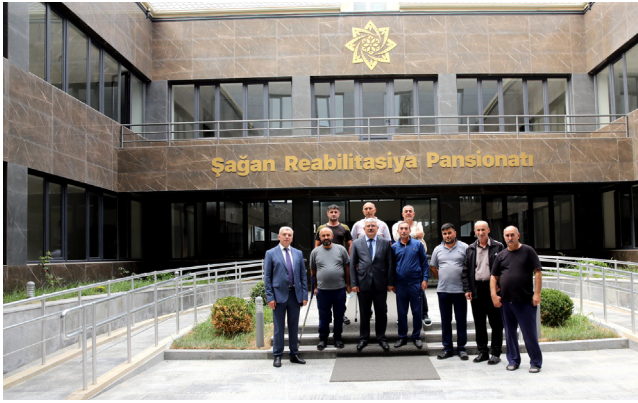
Şağan Reabilitasiya Pansionatında müalicə alan Vətən müharibəsi qazilərinə baş çəkilib