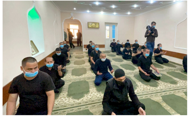
Cəzaçəkmə müəssisələrində şəhidlərimizin ruhuna dualar oxunub, namaz qılınıb

hərtərəfli dövlət qayğısı ilə əhatə olunduğunu bildirib.