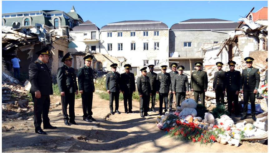
Erməni silahlı birləşmələri tərəfindən Gəncə şəhərinə atılmış raket zərbələri nəticəsində dağıdılmış əraziyə baş çəkilib

EMəmmədov Anım Günü ilə əlaqədar xarici ölkələrin Ədliyyə Nazirliklərinə və nüfuzlu beynəlxalq təşkilatlara müraciətlərin göndərildiyini vurğulayıb, post-konflikt dövründə Vətən müharibəsi iştirakçılarının, onların və şəhidlərimizin ailə üzvlərinin müraciətlərinə xüsusi həssaslıqla yanaşıaraq qaldırılan məsələlərin həlli üzrə zəruri tədbirlər görüldüyünü, ötən müddət ərzində 60-dan çox belə şəxslərin ədliyyə orqanlarında müvafiq işlə təmin edildiyini bildirib.