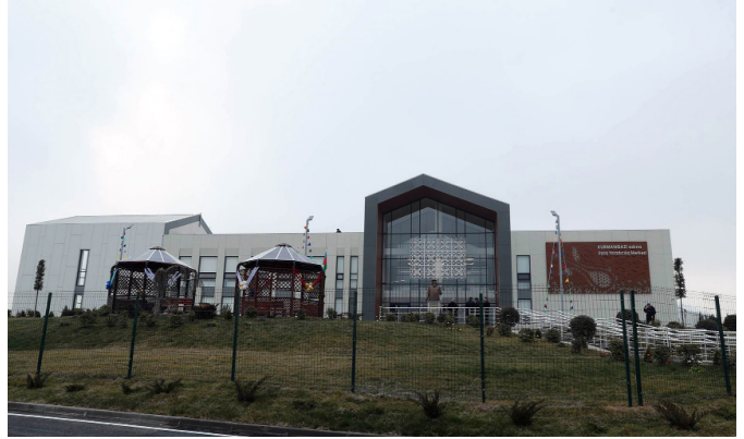
Füzuli rayonunda Kurmanqazi adına Uşaq Yaradıcılıq Mərkəzinin açılışı

qəlbədən sevindiğini bildirib. Qazaxıstan-Azərbaycan münasibətlərinə toxunaraq Ali Dövlətlər-arası Şurasının iclasının keçirilməsini tarixi hadisə adlandırıb.