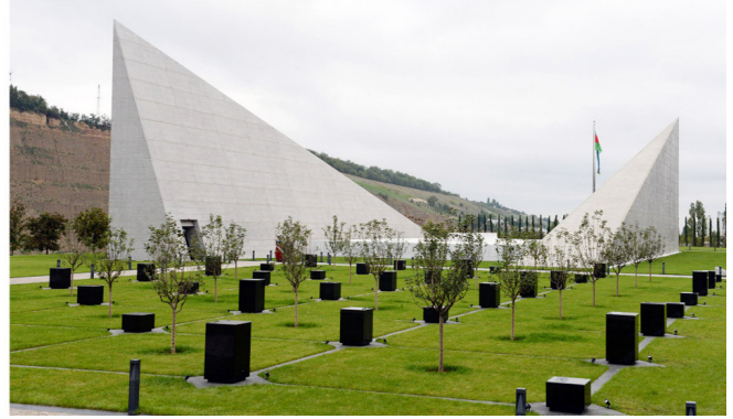
Quba Soyqırımı Memorial Kompleksi

bədə isə Şamaxının 72 kəndində ermənilərin 7 min nəfəri, o cümlədən 1653 qadın və 965 uşağı öldürdüyü göstərilir. Fövqəladə İstintaq Komissiyası tərəfindən həmin dövrdə Şamaxı qəzasındakı 120 kəndin 86-sının erməni təcavüzünə məruz qaldığı təsdiqlənib. Komissiya öz işini dayandırdığından digər 34 kənd haqqında məlumat toplamaq mümkün olmayıb.