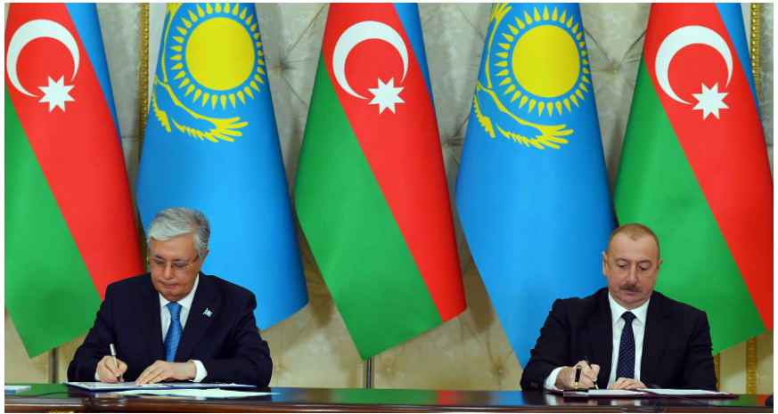
Azərbaycan-Qazaxıstan sənədlərinin imzalanması mərasimi

rədə Qazaxıstan Prezidentini məlumatlandırıldığını bildirərək Prezident Tokayevin təşəbbüsü olan Füzuli şəhərindəki Kurmanqazı adına Uşaq Yaradıcılıq Mərkəzinə görə, Azərbaycanın suverenliyinin bərpası məsələsində həmrəylik sözlərinə görə təşəkkürünü ifadə edib, Qazaxıstanın bizim etibarlı dostumuz və müttəfiqimiz olduğunu vurğulayıb.