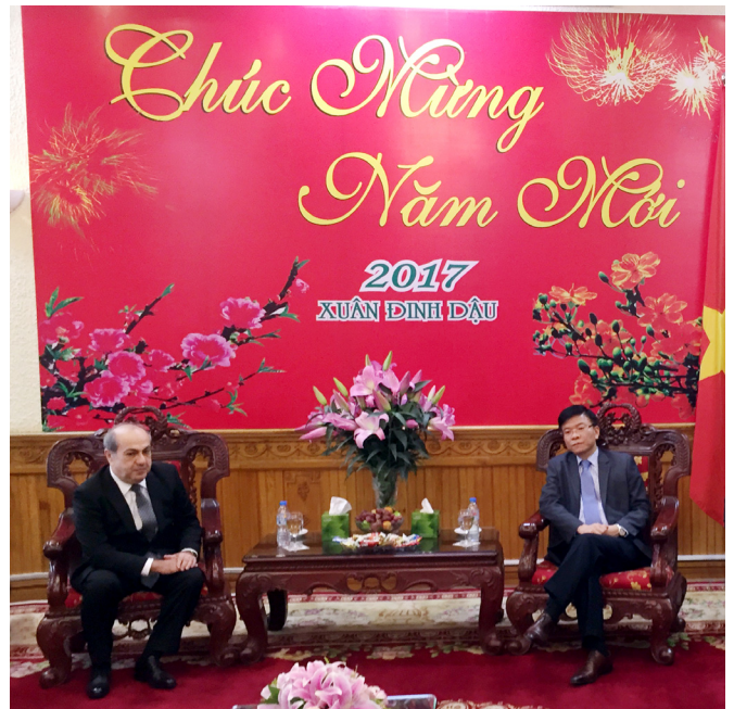
Vyetnamın ədliyyə naziri Le Tanq Lonq ilə görüş

Növbəti gün Hökumətlərarası Komissiyanın üzvləri Vyetnamın Prezidenti Çan Day Kuanq tərəfindən qəbul edilib. Görüşdə Azərbaycan-Vyetnam Hökumətlərarası Komissiyasının ilk iclasının uğurla