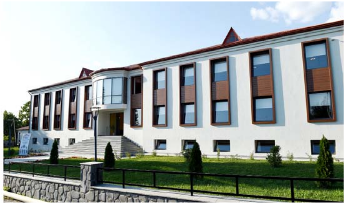
Qaxda Heydər Əliyev Fondunun təşəbbüsü ilə inşa olunmuş körpələr evi-uşaq bağçasının açılışı