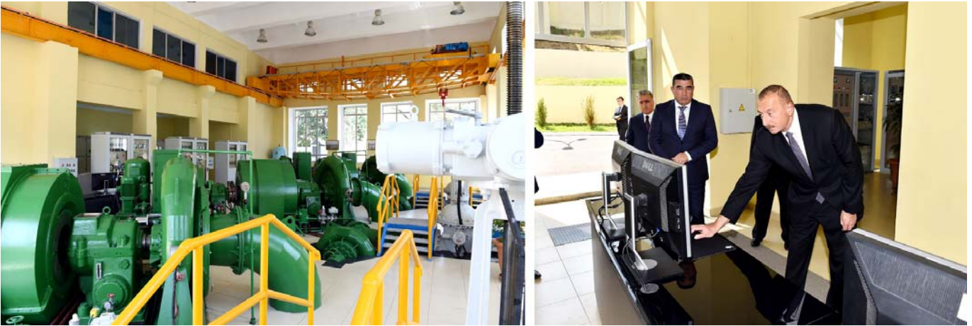
Göygöl rayonu "Çiçəkli" Su Elektrik Stansiyasının istifadəyə verilməsi

A vqustun 19-da Azərbaycan Prezidenti qərb bölgəsinə səfər edib. Əvvəlcə Göygöl rayonunda səfərdə olan dövlətimizin başçısı Qələbə parkında yaradılan şəraitlə tanış olub, əsaslı şəkildə yenidən qurulan 4 saylı körpələr evi-uşaq bağçasının açılışında iştirak edib.