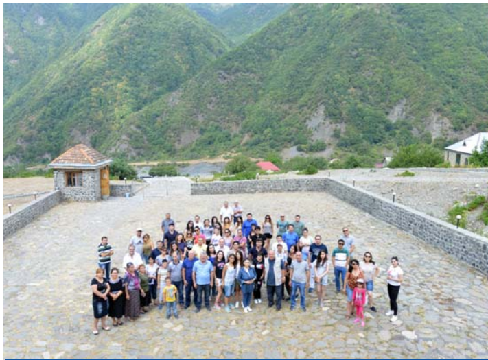
Sumuqqala ilə tanışlıq

İstirahət zamanı əməkdaşlar həmçinin, bölgənin mədəni-tarixi abidələri,