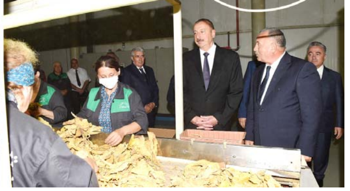
Zaqatala rayonu tütün emalı zavodunun fəaliyyəti ilə tanışlıq

növünün Fransa və Türkiyə "Lavanda" növlərindən yağlılıq dərəcəsi 20 faiz çoxdur. İllik gücü 1250 ton yaş gül, 250 litr qızıl gül və 6 min litr "Lavanda" gül yağı olan müəssisədə istehsal edilən yağlar "AzRose" adı ilə bazarlara çıxarılacaq. Gələcəkdə isə həmin yağlardan istifadə etməklə müxtəlif ətriyyat, yuyucu, məişət və qida sənayesində istifadə olunan məhsulların istehsalı nəzərdə tutulur.