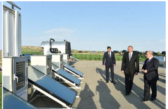
Samux Aqroenerji Yaşayış Kompleksi ilə tanışlıq