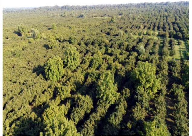
Qax rayonu Lələpaşa kəndinin sakini Allahverdi Şirinovun fındıqçılıq təsərrüfatında yaradılan şəraitlə tanışlıq