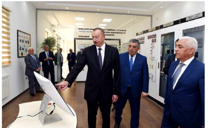
Zaqatala rayonu "Bəhmətli" elektrik yarımstansiyasının istifadəyə verilməsi