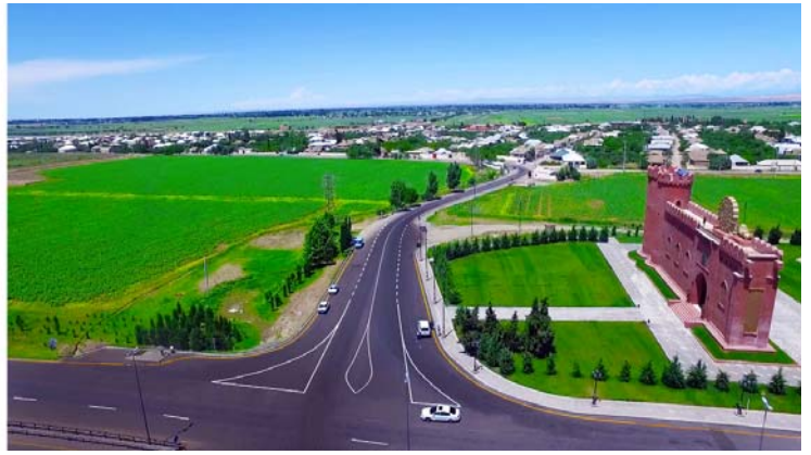
Zazalı-"İmamzadə" kompleksi-Gəncə avtomobil yolunun açılışı

sinə üçmərtəbəli inzibati-laboratoriya binası, tövlə, yem anbarı və yemhazırlama sahəsi, baytarlıq klinikası, karantin məntəqəsi daxildir.