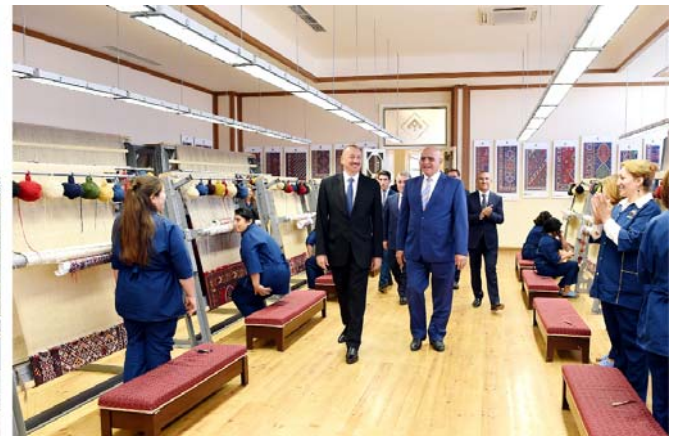
"Azərxaqça" ASC-nin Şəmkir filialının açılışı