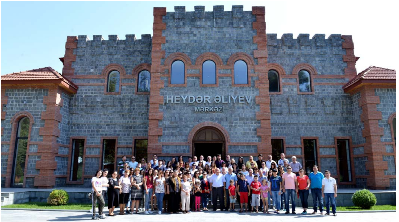
Qax rayonu Heydər Əliyev Mərkəzi ilə tanışlıq

Əsrarəngiz təbiəti, mülayim və saf dağ iqlimi, zəngin fauna və florası, yeraltı və yerüstü su sərvətləri, çayları, şlalələri, mineral bulaqları, meşələri, habelə ləziz mətbəxi və yüksək qo-