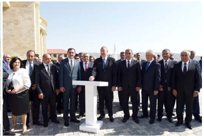
Gədəbəy rayonunun içməli su təchizatı layihəsinin açılışı