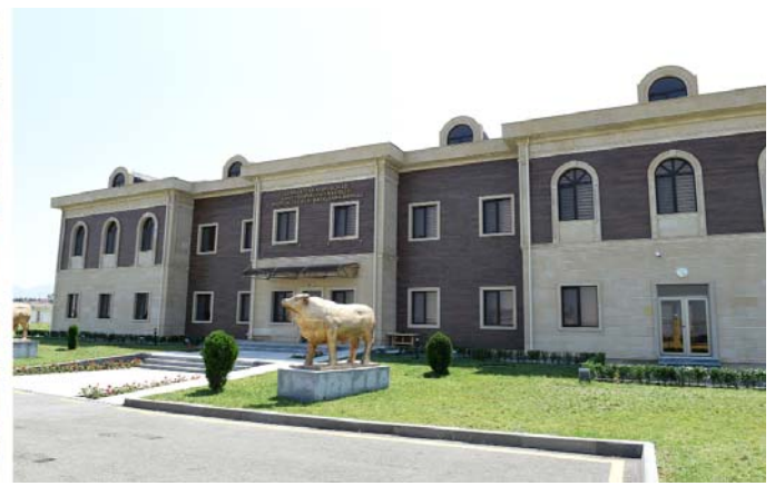
Göygöldə Respublika Süni Mayalanma Mərkəzinin açılışı