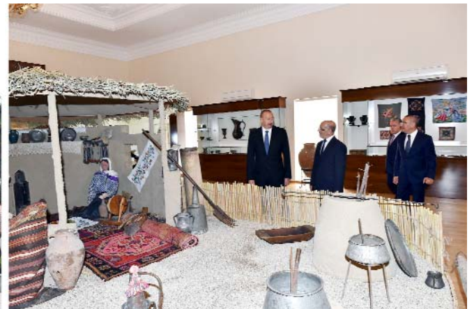
Şəmkir rayonunda əsaslı şəkildə yenidən qurulan Tarix-Diyarşünaslıq Muzeyində yaradılan şəraitlə tanışlıq