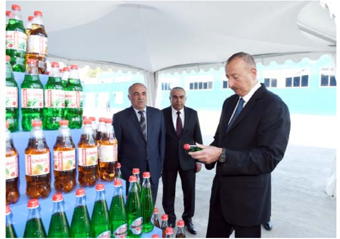
Gədəbəy rayonu limonad zavodunun istifadəyə verilməsi

Ölkə rəhbəri Samux Aqroenerji Yaşayış Kompleksi ilə tanış olub. Alternativ və bərpa olunan enerji mənbələri hesabına hibrid tipli günəş, külək, geotermal, enerji və bioenerji istehsalı stansiyasından, enerji təminatlı kənd təsərrüfatı məhsullarının tədarükü, emalı, satışı sahələrindən ibarət olan Samux Aqroenerji Yaşayış Kompleksi özündə yüksək texnologiyaları, müasir idarəetmə sistemlərini birləşdirir. Kompleks alternativ və bərpa olunan enerji mənbələri hesabına işləyən hibrid enerji stansiyasında il ərzində istehsal ediləcək 120 milyon kilovat/saatdan artıq elektrik və 100 min heka kaloridən çox istilik enerjisi rayonun enerjiyə tələbatını tam ödəməklə, ildə 60 milyon kubmetr təbii qaza qənaət olunmasına və atmosfərə buraxılan karbon qazının həcminin 90 min ton azaldılmasına imkan verəcək. Bununla yanaşı, aqrokompleksin fəaliyyəti ildə on minlərlə ton meyvə-tərəvəz, süd və ət məhsullarının istehsalına, 2000-dən çox daimi yeni iş yerinin açılmasına şərait yaradacaq. Həmçinin, "Azguntex" zavodunda hazırlanan meyvə