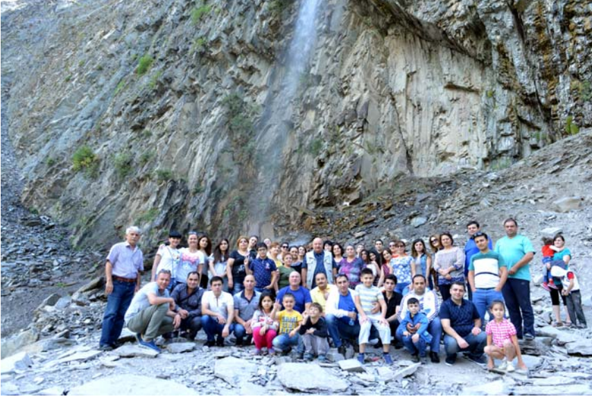
Ramramay şlaləsi ilə tanışlıq

naqərvərliyi ilə seçilən Qax rayonu ilin bütün fəsilərində cəlbedicidir.