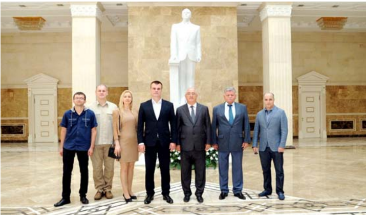
Ali Məhkəmədə görüş və Məhkəmənin binası ilə tanışlıq

Söhbət zamanı Ermənistan-Azərbaycan Dağlıq Qarabağ münaqişəsinin acı həqiqətləri diqqətə çatdırılaraq bu münaqişə ilə bağlı məsələlərin beynəlxalq hüquq çərçivəsində həllində Belarus dövlətinin ədalətli mövqe və qətiyyətli addım