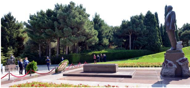
Ümummilli lider Heydər Əliyevin məzarını ziyarət