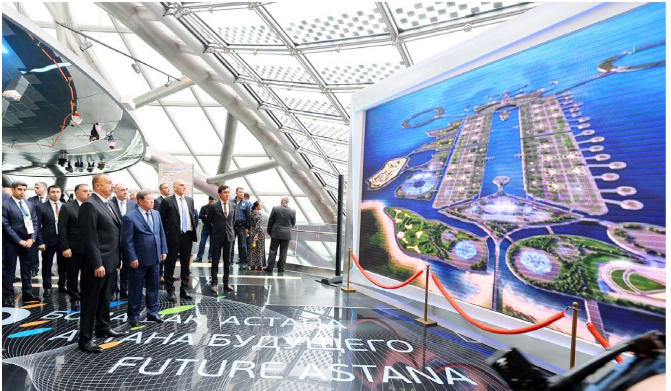
"EXPO 2017 Astana" beynəlxalq sərgisində Azərbaycanın və Qazaxıstanın milli pavilyonları ilə tanışlıq

Səfər zamanı Azərbaycan Prezidenti İlham Əliyev "EXPO 2017 Astana" beynəlxalq sərgisində Azərbaycanın və Qazaxıstanın milli pavilyonları ilə tanış olub. Azərbaycan da daxil olmaqla 115 ölkə, 22 beynəlxalq təşkilatın təmsil olunduğu sərginin keçirilməsi enerji sahəsi üzrə əməkdaşlığın daha da inkişafına, həmçinin iştirakçı ölkələrdə tətbiq olunan yeni texnologiyaların mübadiləsinə imkan yaradır. Ümumi sahəsi 174 hektar olan sərgidə gələcəyin texnologiyaları, dünyanın enerjiyə qənaəti və bu sahədə ən son ixtiralar, yeniliklər, nüvə enerjisi kimi enerji növləri nümayiş etdirilib.