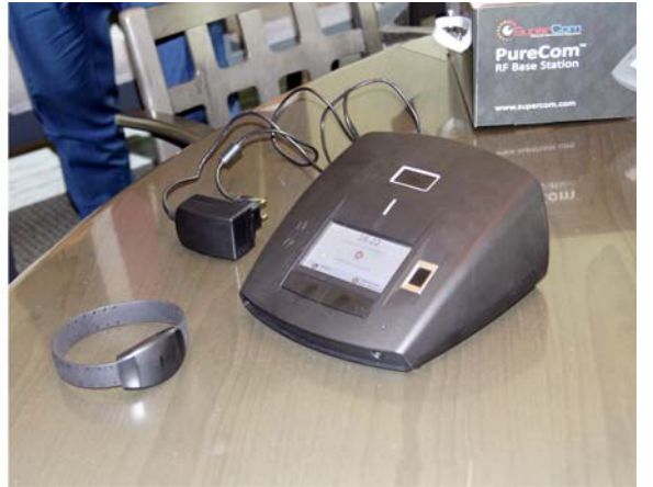
“Elektron qolbaq” qurğusu ilə tanışlıq

Səfər çərçivəsində Latviyanın ədliyyə naziri Dzintars Rasnaçs ilə keçirilmiş görüşdə ölkələrimiz arasında dostluq və əməkdaşlıq münasibətlərinin inkişafı, dövlət başçılarının qarşılıqlı səfərlərinin bu əlaqələrin möhkəmlənməsində xüsusi rolu qeyd olunaraq, cari ilin