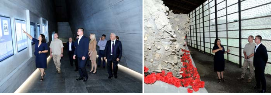
Quba Soyqırımı Memorial Kompleksini ziyarət

nümayiş etdirdiyi bildirilib, Belarus tərəfi münaqişənin Azərbaycanın ərazi bütövlüyü çərçivəsində həllinə tərəfdar olduğunu, ölkəmizin haqlı mövqeyini dəstəklədiyini söyləyib.