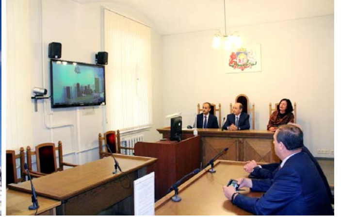
Riqa regional məhkəməsi ilə tanışlıq

iyulunda Azərbaycan Prezidenti İlham Əliyevin Latviyaya səfəri zamanı iki ölkə arasında imzalanmış strateji tərəfdaşlığa dair Birgə Bəyannamənin və digər mühüm sənədlərin ikitərəfli münasibətlərimizin genişləndirilməsinə böyük təkan verdiyi vurğulanıb.