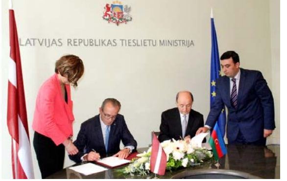
Latviyanın ədliyyə naziri Dzintars Rasnaçs ilə görüş və iki ölkənin Ədliyyə nazirlikləri arasında əməkdaşlığa dair Anlaşma Memorandumunun imzalanması

B eynəlxalq hüquqi əməkdaşlığın genişləndirilməsi məqsədilə ölkəmiz tərəfindən xarici, xüsusilə Avropa İttifaqı dövlətləri ilə ikitərəfli münasibətlər inkişaf etməkdədir.