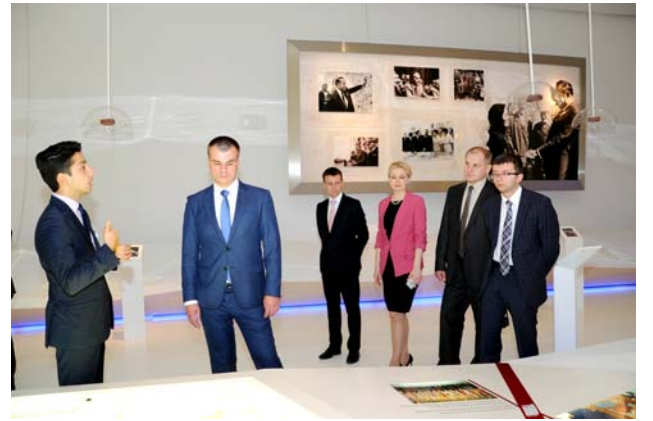
Heydər Əliyev Mərkəzi ilə tanışlıq