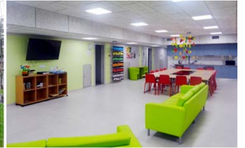
Oleyne ixtisaslaşdırılmış penitensiar müəssisəsi ilə tanışlıq