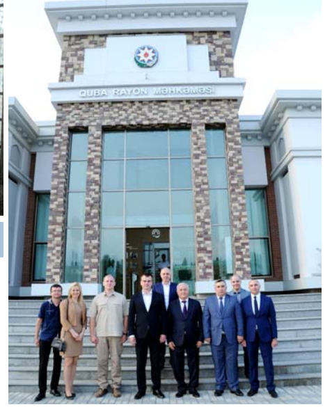
Quba Rayon Məhkəməsinin müasir binası ilə tanışlıq

Səfər çərçivəsində Belarus nümayəndə heyəti Bakının müasir rəmzlərindən sayılan möhtəşəm Heydər Əliyev Mərkəzi ilə, həmçinin bölgələrdə yerli və regional ədliyyə qurumlarının fəaliyyəti, müasir məhkəmə infrastrukturu və informasiya texnologiyalarının tətbiqi, habelə Quba Soyqırımı Memorial Kompleksi ilə tanış olublar.