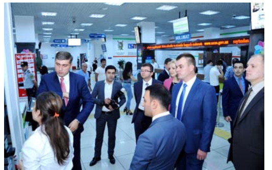
“ASAN xidmət”in fəaliyyəti ilə tanışlıq