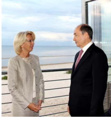
Latviya Seyminin sədri İnara Murnietse ilə görüş