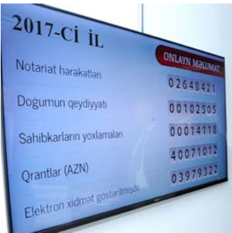
Elektron notariat sistemi, müxtəlif reyestrlər ilə tanışlıq