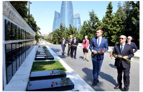
Şəhidlərin xatirəsinə ehtiram

A zərbaycan-Belarus dostluq və səmərəli əməkdaşlıq münasibətlərində hüquqi əlaqələr də xüsusi yer tutur.