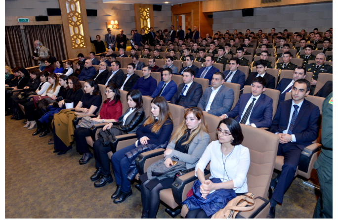
Ədliyyə işçiləri Nizami Kino Mərkəzində "Yaddaşın rəmzi. Quba-1918" filmi izləyiblər

Öndərin 1998-ci ildə imzaladığı Fərmanla martın 31-nin Azərbaycanlıların Soyqırımını Günü elan edildiyi vurğulanıb.