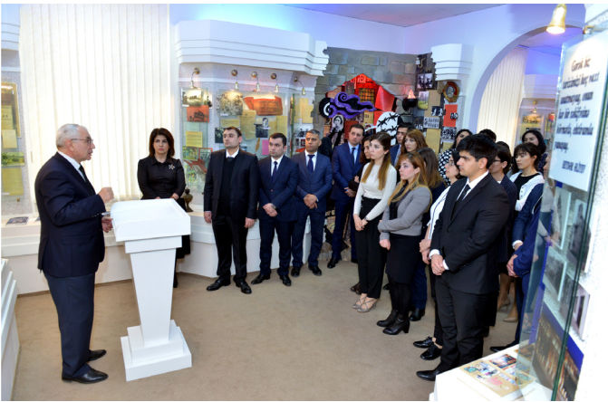
Ədliyyə tarixi muzeyində gənclərlə görüş

Tədbirlərdə vaxtilə Azərbaycan Xalq Cümhuriyyəti Ədliyyə Nazirliyinin nəzdində fəaliyyət göstərmiş Fövqəladə İstintaq Komissiyasının soyqırımının nəticələrinin araşdırılmasında, tarixi həqiqətlərin aşkara çıxarılmasında rolundan bəhs olunub, bu dəhşətli faciəyə yalnız müstəqillik dövründə ümummilli lider Heydər Əliyevin hakimiyyətə qayıdışından sonra siyasi-hüquqi qiymətin verildiyi, Ulu