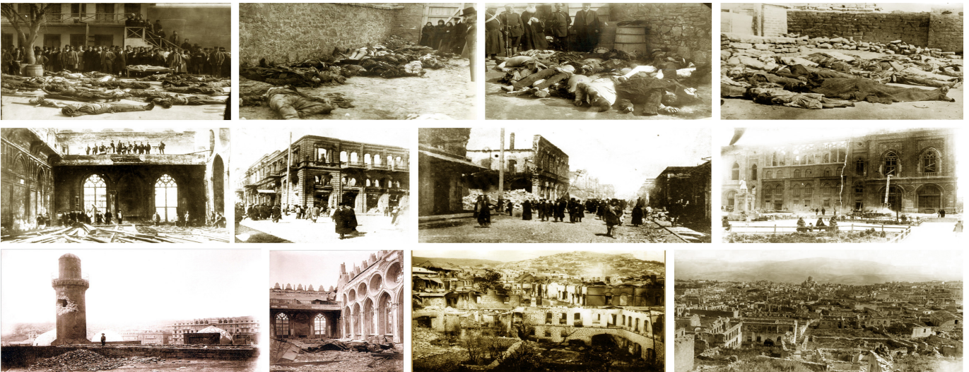
1918-ci il mart soyqırımının nəticələri

Dövlət başçısının 2018-ci il yanvarın 28-də imzaladığı Sərəncama əsasən, 1918-ci il azərbaycanlıların soyqırımının 100 illiyi təkə Azərbaycanda deyil, dünyanın bir çox guşələrində yaşayan həmvətənlərimiz, diaspor təşkilatı, xaricdəki səfirliklərimiz tərəfindən geniş yad edilir. Erməni-bolşevik silahlı dəstələrinin 100 il əvvəl azərbaycanlılara qarşı törətdikləri bəşəri cinayətlər barədə həqiqətlərin dünya ictimaiyyətinə daha dolğun çatdırılması məqsədilə çoxsaylı tədbirlər həyata keçirilib.