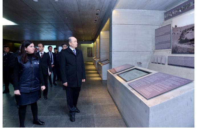
Quba Soyqırımı Memorial Kompleksini ziyarət

Ə srlər boyu xalqımıza qarşı etnik təmizləmə siyasəti həyata keçirən təcavüzkar erməni millətçiləri tərəfindən 1918-ci ildə törədilmiş azərbaycanlıların soyqırımından 100 il ötür. Bununla əlaqədar Azərbaycan Respublikasının Prezidenti tərəfindən xüsusi Sərəncam imzalanıb və qəbul olunmuş müvafiq tədbirlər planına uyğun olaraq ölkəmizdə və onun hüdüdlərindən kənarında silsilə tədbirlər keçirilir.