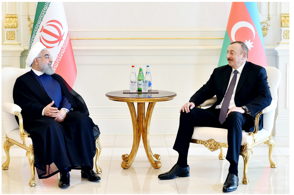
Azərbaycan və İran prezidentlərinin təkbətək görüşü

Rəsmi qarşılama mərasimindən sonra Azərbaycan Prezidenti İlham Əliyevin və İran Prezidenti Həsən Ruhaninin təkbətək görüşü keçirilib. Görüşdə regionun orta q tarix və mədəniyyətə sahib iki böyük xalqın, Azərbaycan-İran dostluq və qar daşlıq əlaqələrinin inkişafından məmnunluq ifadə olunub, bütün sahələr üzrə çox yaxşı əmək daşlıq edildiyi, siyasi, iqtisadi, mədəni, enerji, nəqliyyat