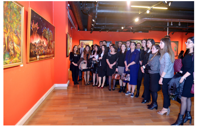
"Genosid-100" sərgisi ilə tanışlıq