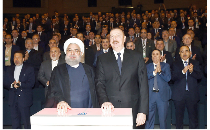
"Azərmaş" ASC və "İran Khodro" şirkətinin birgə layihəsi olan "Xəzər" avtomobil zavodunun işə salınması

diq edir. Yüksək səviyyəli siyasi əlaqələrimizin iqtisadi layihələrin uğurlu icrasına imkan verdiyini bildiren dövlətimizin başçısı İran-Azərbaycan əlaqələrinin nəinki iki ölkə üçün, region üçün böyük əhəmiyyətə malik olduğunu söyləyib. Qeyd edib ki, ticarət əlaqələrinin indiki səviyyəsi bizim əlaqələrimizin səviyyəsini əks etdirmir. Ona görə də ticarət dövriyyəsinin artırılması üçün praktiki addımlar atılmalıdır. Gələcəkdə qarşılıqlı ixracımızın artacağına əminliyini ifadə edən Prezident İlham Əliyev Neftçalada yaradılan birgə müəssisənin və İranda Azərbaycan sərmayəsi ilə qurulan yük terminalının iqtisadi əlaqələri gücləndirdiyini bildirib. Dövlətimizin başçısı Azərbaycan və İran tərəfinin ciddi səyləri ilə reallaşan Şimal-Cənub nəqliyyat dəhlizinin yaradılması ilə bağlı görülən işlərdən danışib, Astara-Rəşt dəmir yolunun tikintisinin maliyyələşdirilməsi və Xəzər dənizindəki blokların işlənməsi ilə bağlı imzalanmış müqavilələrin əhəmiyyətli olduğunu söyləyib.