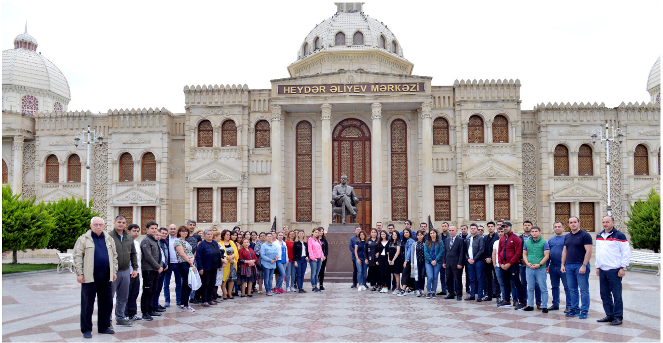
Xaçmaz şəhəri Heydər Əliyev Mərkəzinə səfər

daşların mənafeələrini qoruyur, onlara Komitənin xətti ilə müxtəlif məsələlərdə köməklik göstərilir.