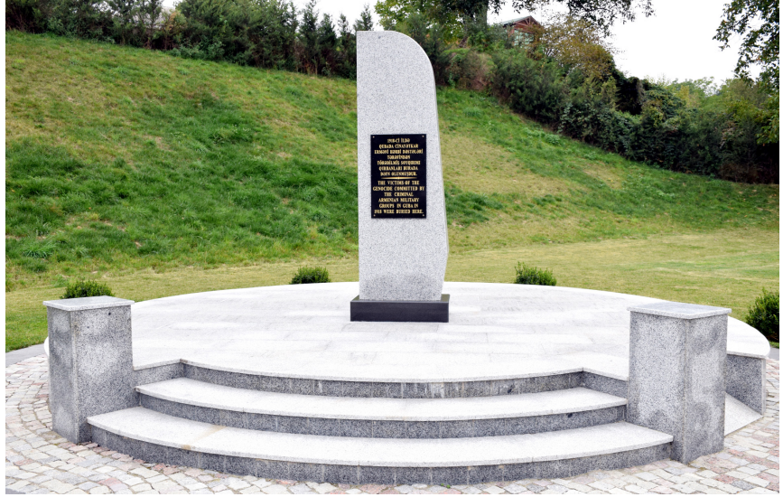
Quba Soyqırımı Memorial Kompleksini ziyarət

Bu sahədə nazirliyin Birləşmiş Həmkarlar İttifaqı Komitəsi yaxından iştirak edir, əmək, sosial-iqtisadi, həmçinin əməyin mühafizəsi haqqında qanunvericiliyə uyğun əmək-