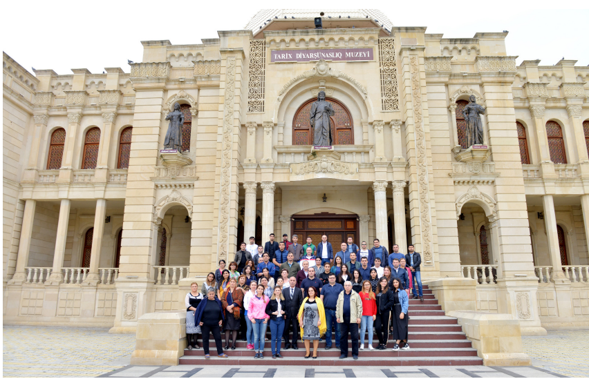
Xaçmaz şəhəri Şəxsiyyətlər muzeyi ilə tanışlıq

Səfər çərçivəsində əməkdaşların həmçinin, Xaçmazın Nabran qəsəbəsində yerləşən "River-Inn" turizm mərkəzində istirahəti təşkil edilib, bir-birindən maraqlı musiqili-əyləncəli proqramlar, intellektual oyunlar keçirilib. Gəzinti-istirahət turu işçilərdə xoş ovqat və zəngin təəssürat yaradıb.