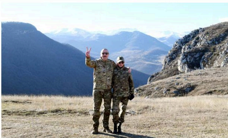
Şuşa şəhəri Cıdır düzündə

Ermənilər Şuşanı tərk edərkən inzibati binalarda da kütləvi oğurluq və talançılığa yol veriblər. Məsələn, bu binadakı bütün kondisionerlər və istilik sistemi avadanlıqlarını söküb aparıblar. Bu, şübhəsiz ki, acgözlüyün, amma həm də oğru xislətinin təzahürüdür. Bu, həm də 30 illik