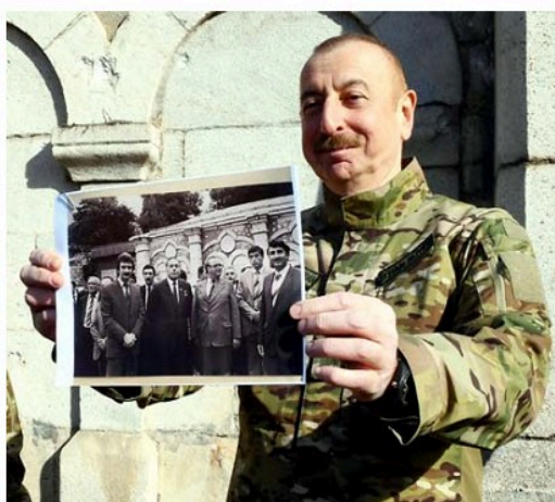
Prezident İlham Əliyev 39 ildən sonra yenidən Şuşada - Natəvan bulağının önündə