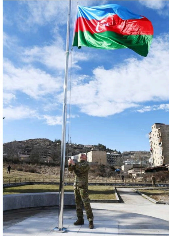
Şuşa şəhərində üçrəngli bayrağımızın ucaldılması

A zərbaycan Respublikasının Prezidenti İlham Əliyev, birinci xanım Mehriban Əliyeva və qızları Leyla Əliyeva yanvarın 14-də Azərbaycanın işğaldan azad edilən mədəniyyət paytaxtı Şuşa şəhərinə səfər ediblər.