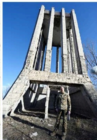
Azərbaycan şairi Molla Pənah Vaqifin dağıdılmış muzey-məqbərə kompleksinin önündə

hər şeyi satıblar ömrü boyu. Büstləri də biz pulla almışıq. O vaxt gətirdirdik və onlar İncəsənət Muzeyinin həyətinə yerləşdirildi.