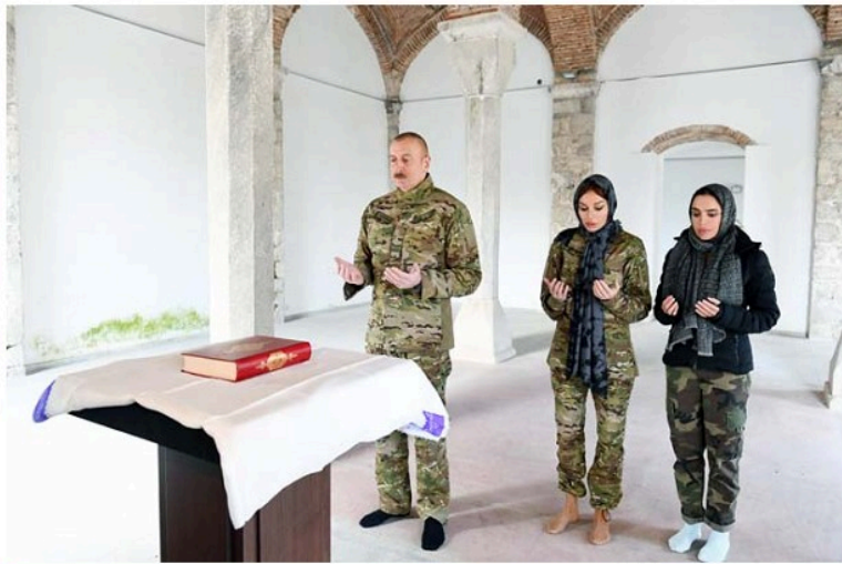
Şuşa şəhərindəki Saati məscidini ziyarət

Prezident İlham Əliyev noyabrın 8-də Şəhidlər xiyabanında Azərbaycan xalqına Şuşanın azad edilməsi müjdəsini verərkən çıxışının sonunda dediyi sözləri bir daha təkrarlayıb: "Əziz Şuşa, sən azadsan!