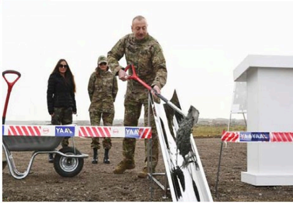
Füzuli-Şuşa yolunun təməlinin qoyulması