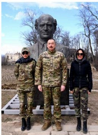
Bülbülün, Natəvanın, Üzeyir Hacıbəylinin büstləri Şuşada yenidən əvvəlki yerlərinə qoyulub