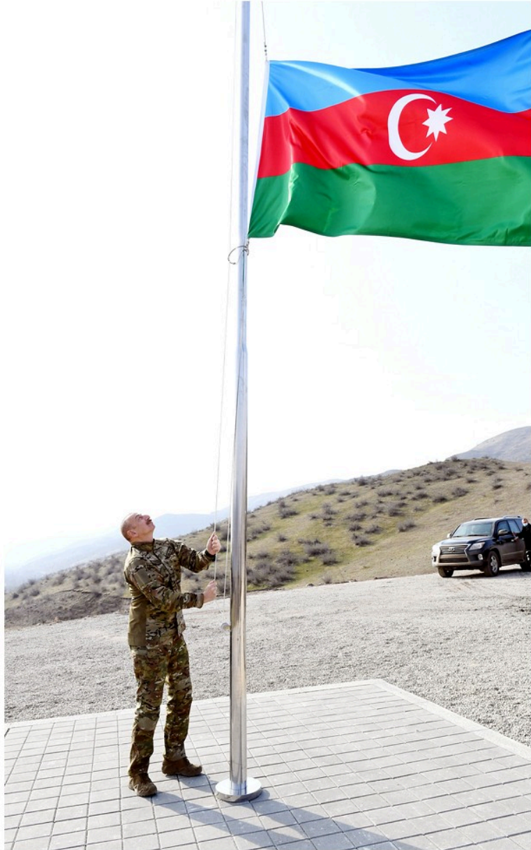
Laçın rayonu Güləbird kəndində Azərbaycan Bayrağının qaldırılması

Sonra Zəngilana gedərkən avtomobili özü idarə edən Prezident İlham Əliyev yol boyunca rayonda olan tədbirlərdən bəhs edib, torpaqların bərpası prosesinin artıq başladığını, bütün şəhərlərimizin baş planlarının hazırlandığını söyləyib, Zəngilan rayonunda birinci "ağıllı kənd" layihəsinin icra ediləcəyini, bərpa ediləcək birinci kəndin dağılmış Ağalı