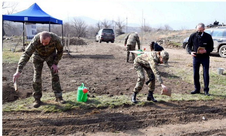
Zəngilan rayonundakı Bəsitçay Dövlət Təbiət Qoruğunun ərazisində