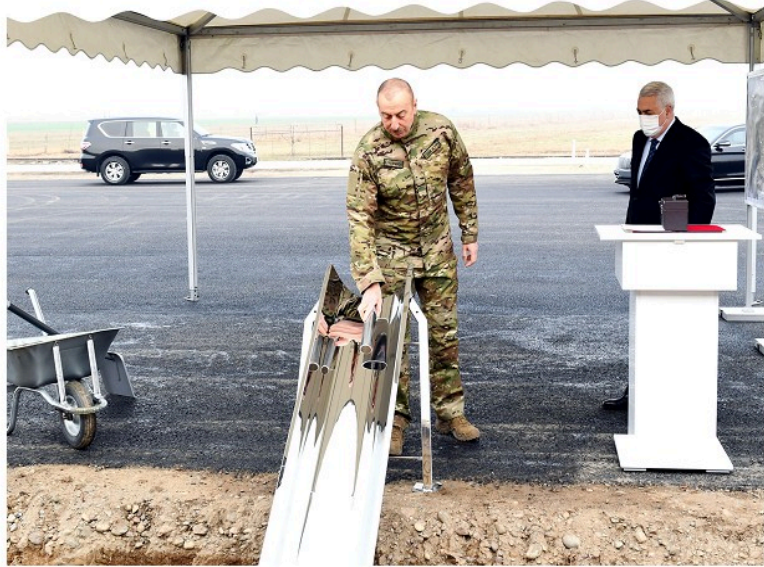
Füzuli rayonunda Horadiz-Ağbənd dəmir yolu xəttinin təməlinin qoyulması

Dövlət başçısı həmçinin Laçın rayonunun cənub hissəsində - Gülübird kəndinin ərazisində su elektron stansiyaları