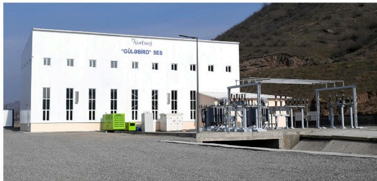
"Gülübird Su Elektrik Stansiyasının açılışı