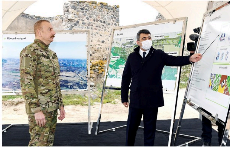
Zəngilan rayonunda "ağıllı kənd" layihəsi icra olunacaq

Ali Baş Komandan Ermənistanda revanşist qüvvələr baş qaldırmağa, Azərbaycanı növbəti təxribatlarla, növbəti müharibə ilə hədələməyə çalışdığını qeyd edərək bildirib ki, "heç vaxt imkan verə bilmərik