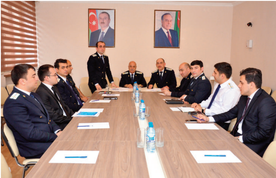
Zaqatala rayon prokurorluğu

Prokurorların cinayət mühakimə icraatı çərçivəsində vəzifələrinin yüksək səviyyədə yerinə yetirmələri, Avropa Şurasının demokratik prinsipləri və dəyərlərinə, təqsirsizlik prezumpsiyası, tərəflərin bərabərliyi prinsipinə, qərəzsiz və obyektiv olmalarına, etik davranışlarına riayət etmələri tövsiyə olunmuşdur.