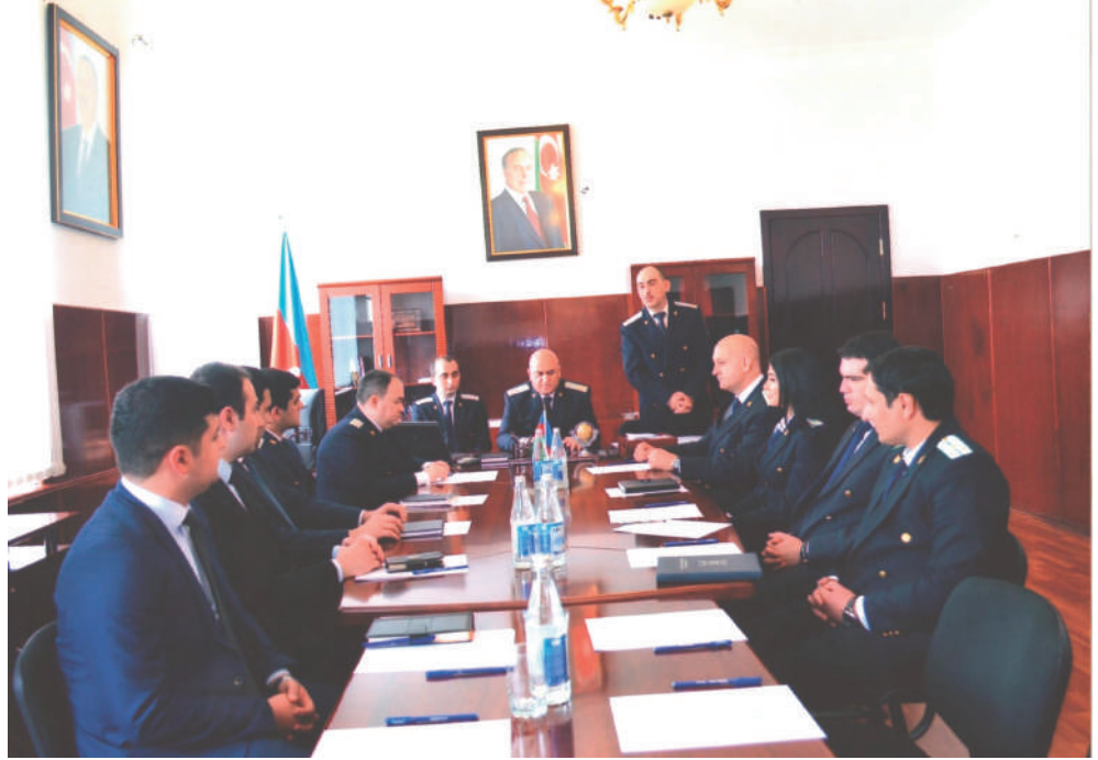
Kürdəmir rayon prokurorluğu

Avropa Şurası Nazirlər Komitəsinin, Avropa Prokurorları Məşvərətçi Şurasının funksiyaları, “İnsan hüquqlarının və əsas azadlıqların müdafiəsi haqqında” Avropa Konvensiyasının əsas müddəaları, insan hüquqlarının qorunması sahəsində beynəlxalq təcrübənin tətbiqi istiqamətində Azərbaycan dövləti və Prokurorluğu tərəfindən görülən işlər barədə məlumat vermişlər.