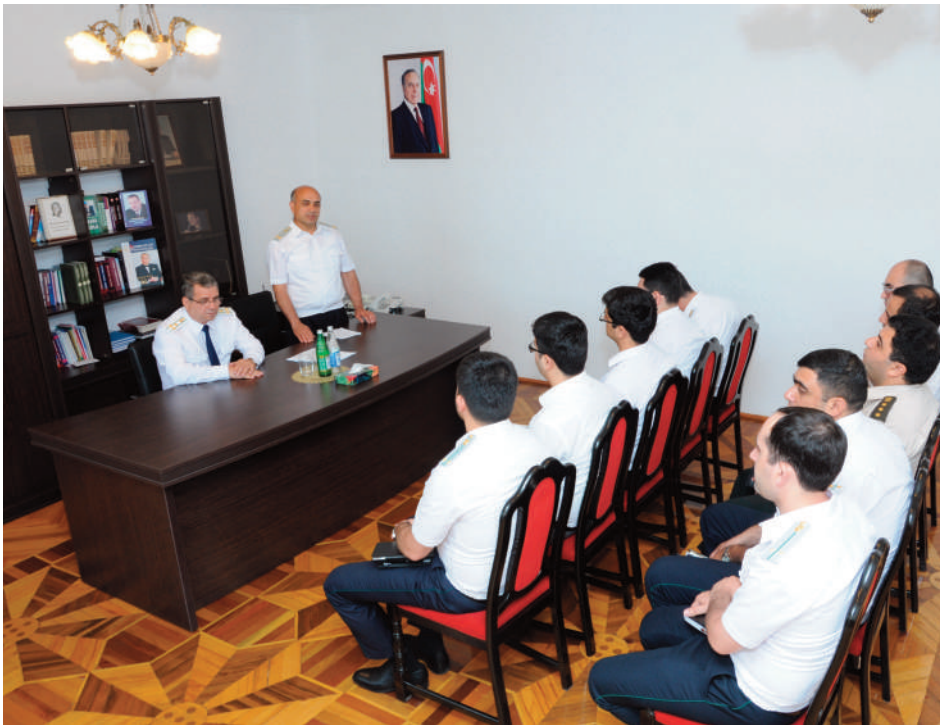
Astara rayon prokurorluğu

axtarışına, həbsinə, müsadirəsinə və terrorçuluğun maliyyələşdirilməsinə dair” Konvensiyanın müddəaları izah edilmişdir. Konvensiyanın ratifikasiyasından irəli gələrək cinayət yolu ilə əldə edilmiş pul vəsaitlərinin və ya digər əmlakın leqallaşdırılmasına və terrorçuluğun maliyyələşdirilməsinə qarşı mübarizə sahəsində Azərbaycanda qəbul edilən normativ hüquqi aktlar, milli fəaliyyət planları, görülən sistemli və ardıcıl tədbirlər barədə məlumat vermişlər.