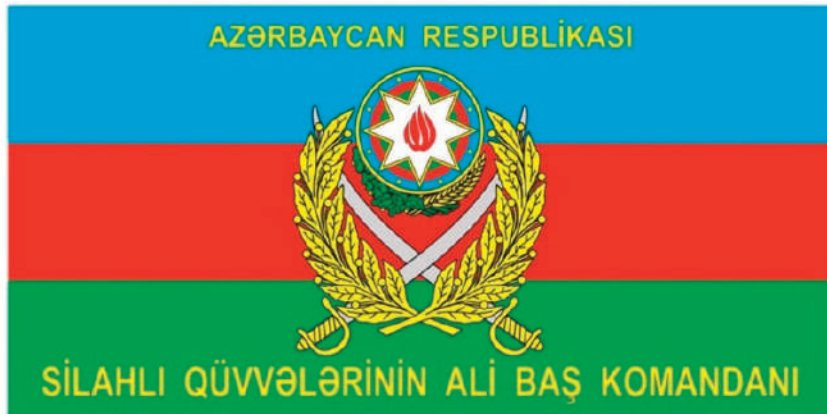
«Azərbaycan Respublikası Silahlı Qüvvələri Ali Baş Komandanının bayrağı»

«Azərbaycan Respublikası Silahlı Qüvvələri Ali Baş Komandanının bayrağının təsviri»nə əlavə