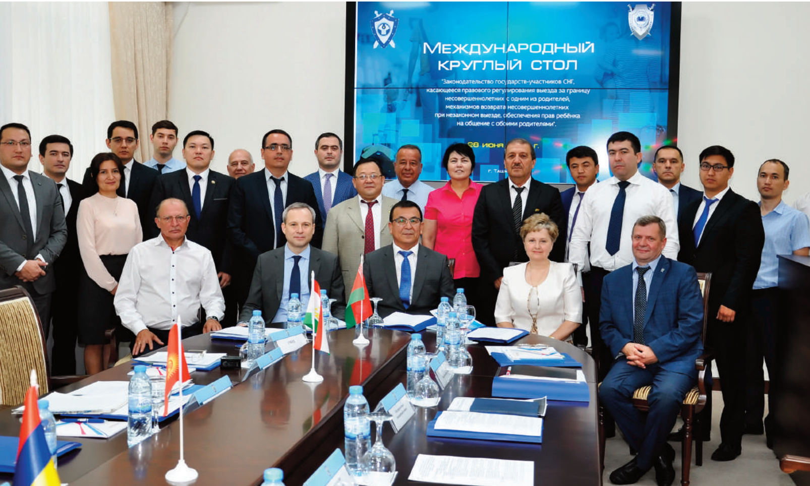
Baş Prokurorluğun Elm-Tədris Mərkəzi

Mövzunun aktuallığı nəzərə alınaraq bu sahədə təcrübə mübadiləsinin davam etdirilməsi qərara alınmışdır.