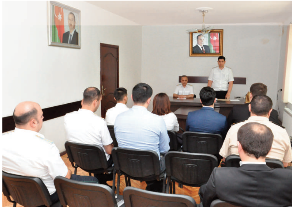
Beyləqan rayon prokurorluğu