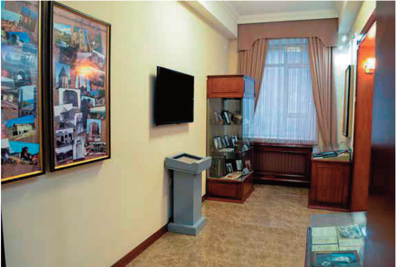
Muzeyin tarix bölməsi