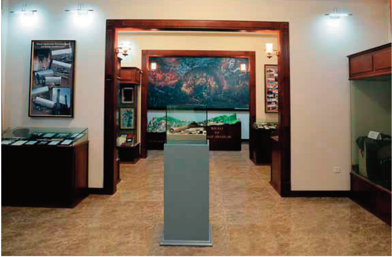
Muzeyin terror bölməsi