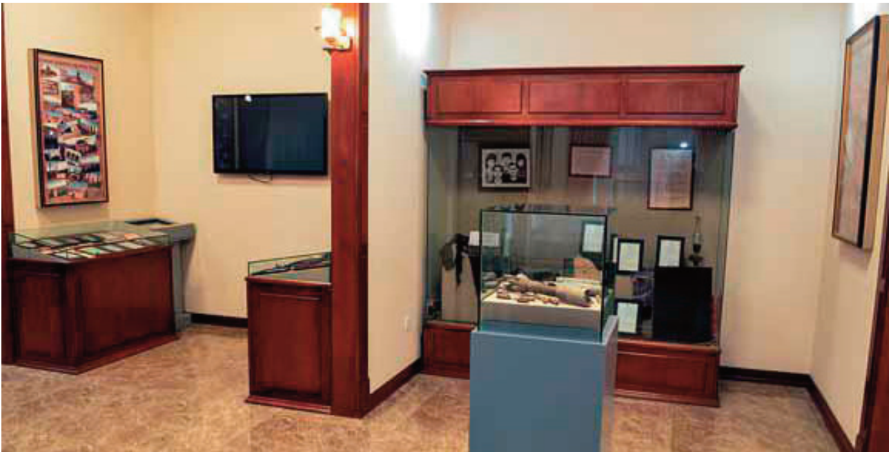
Muzeyin soyqırım bölməsi

Muzey 4 bölmədən – tarix, deportasiyalar-repressiyalar, soyqırımları və terror bölmələrindən ibarət olmaqla 320 kvadratmetrlik sahəni əhatə edir.