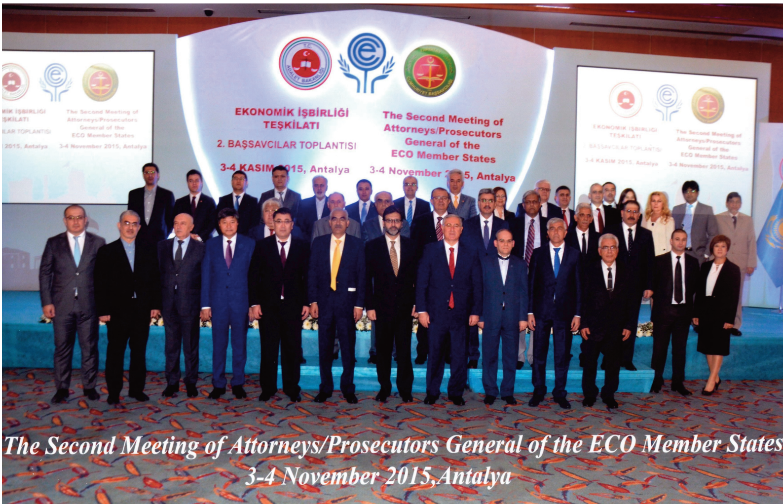
The Second Meeting of Attorneys/Prosecutors General of the ECO Member States 3-4 November 2015, Antalya